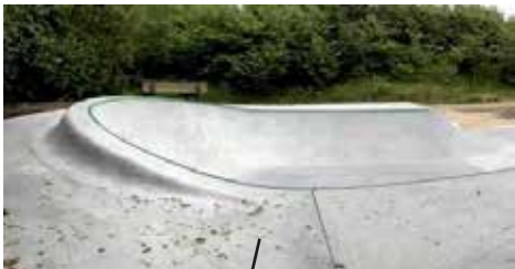
Platform / roll in / transition