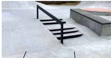
Stairs / rails / ledge / bank