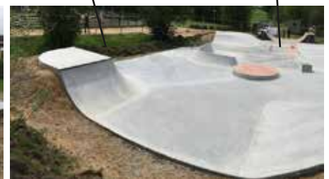
Curved banks with grindstone