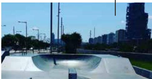
Platform / bank with transition in end