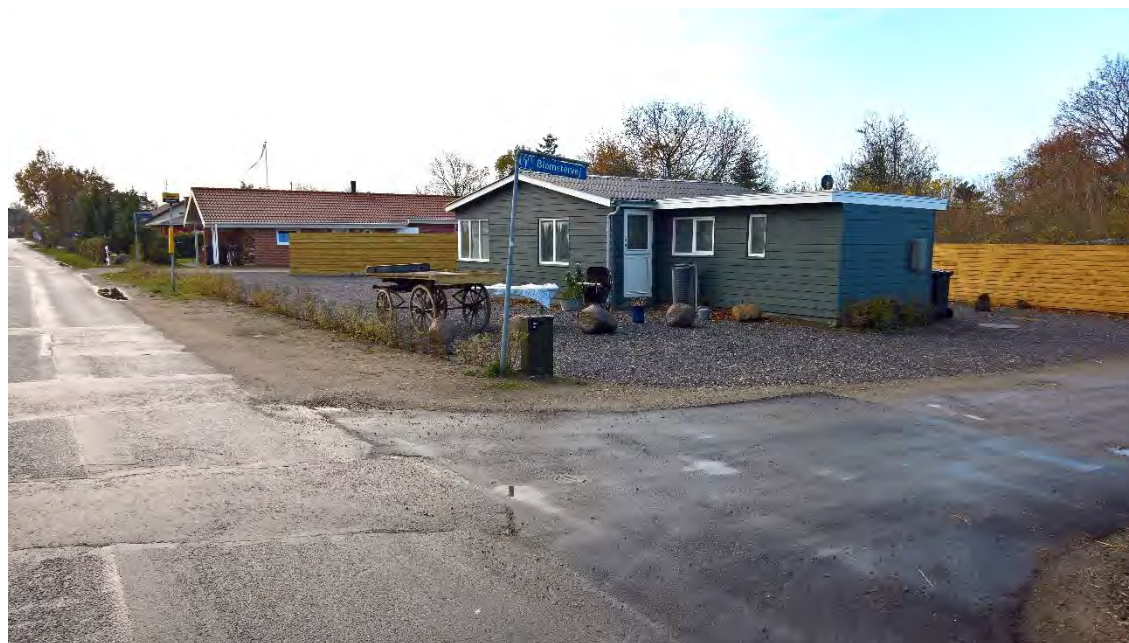
Sådan så området ud i 2018.

En lokalplan skal ledsages af en redegørelse, der beskriver baggrunden, formålet og indholdet i lokalplanen. Herudover beskriver redegørelsen de miljømæssige forhold, forsyningsforhold, forhold til anden planlægning, eksisterende forhold i lokalplanområdet, og om gennemførelse af planlægningen kræver tilladelse og/eller dispensation fra andre myndigheder.