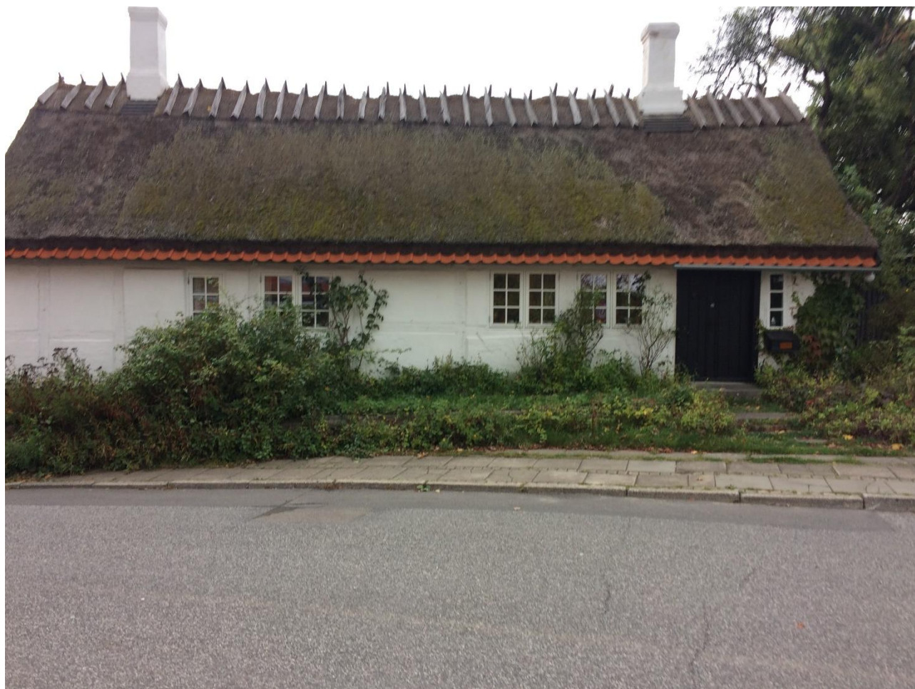
Bisserup Byvej 2