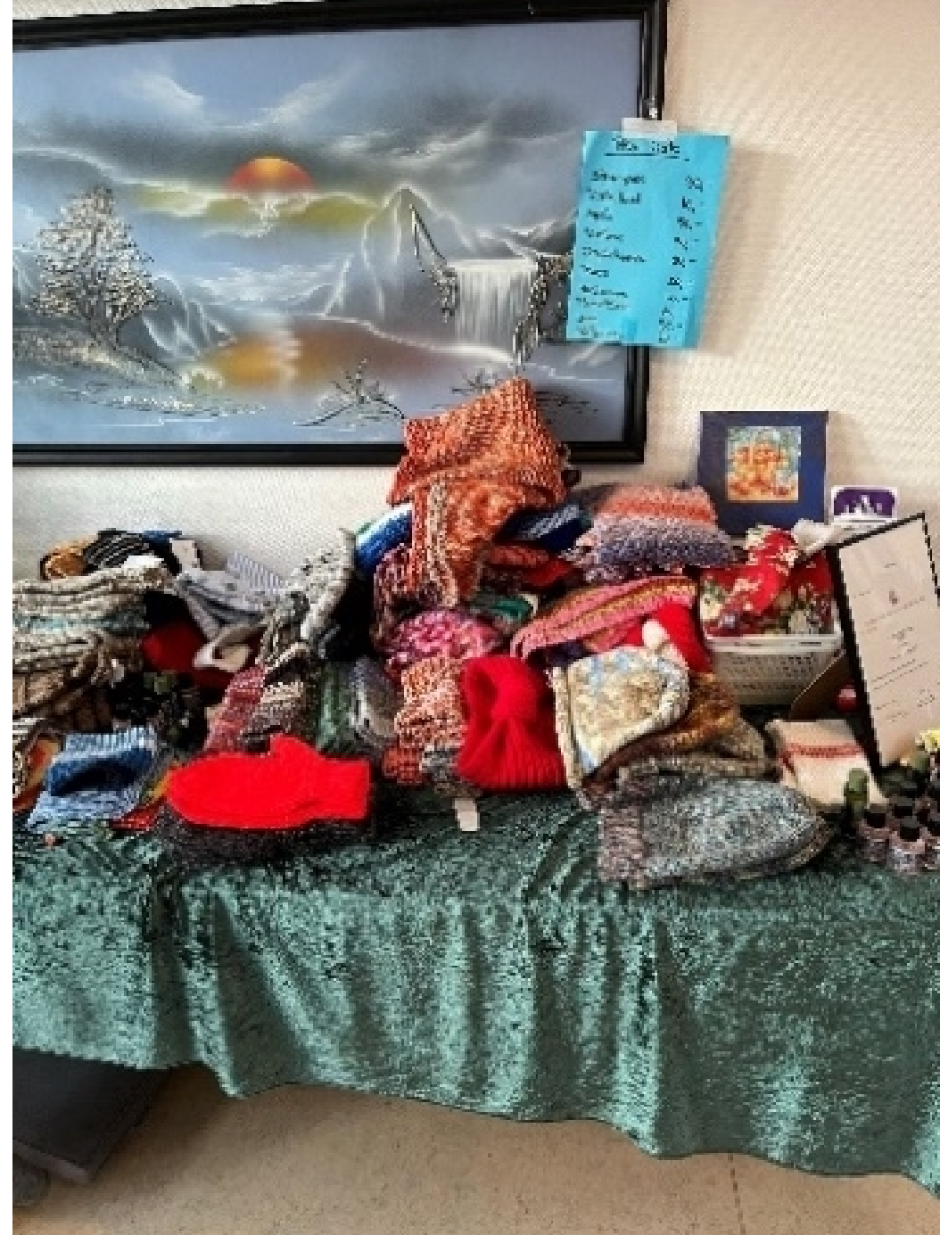
Kirkens Korshær Skælskør