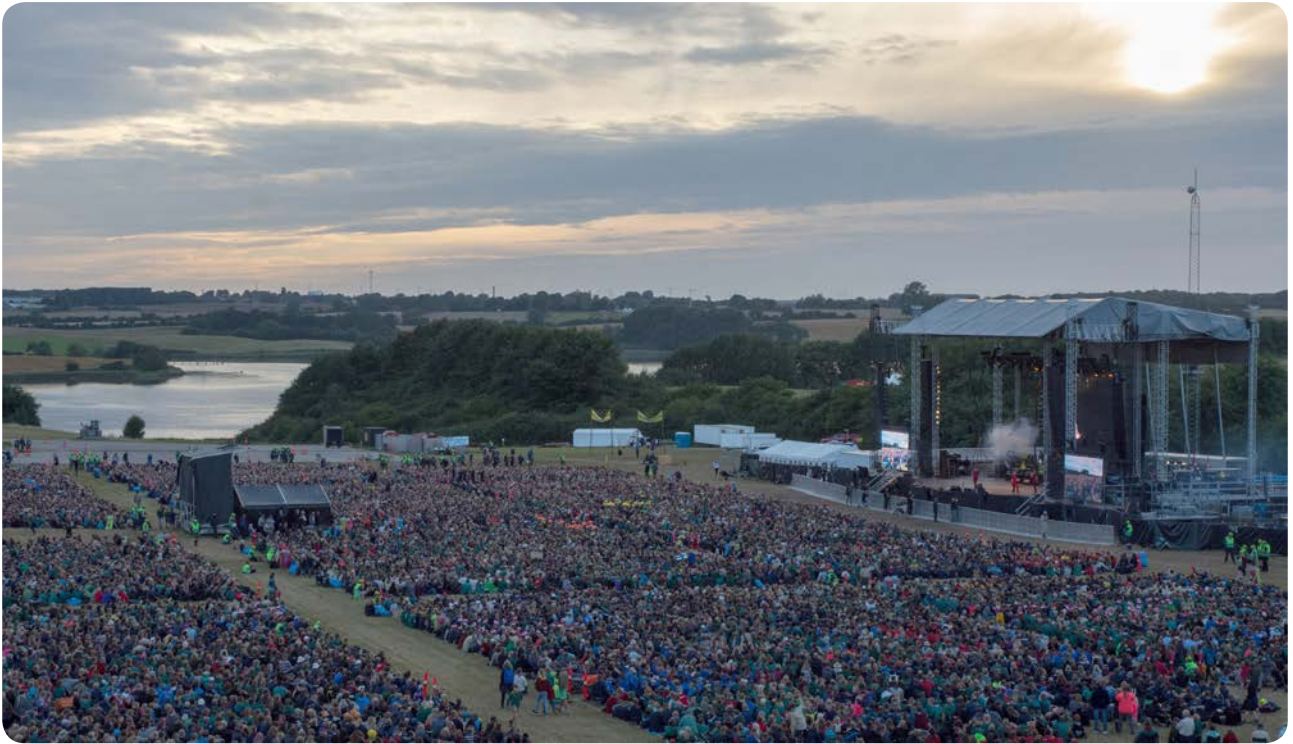
Til afslutningslejrålet tog scenen sig godt ud med aftenhimmel og Alssund i baggrunden.