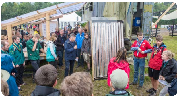
Der var masser af gode idéer til SCOUTmobilen.

Sønderborg Kommunes ProjectZero involverede sig i foråret 2017 i spejdernes værkstedsaktiviteter i lejrens FABtown for de ældste spejdere. Som forberedelse holdt ProjectZero i maj to workshops, hvor lokale spejdere og virksomheder var med til at udvikle grønne udfordringer. Rådgiverne Hansen & Ersbøll Agenda stod i spidsen for processen hos ProjectZero. Ca. 600 spejdere fra 17 år skulle hver dag arbejde i hold i FABtowns store værksteder med professionelt værktøj og teknologi, hvor de kunne bygge eller lave prototyper på ideerne. Fra de to ProjectZero-workshops var der især ideer og input til at styrke bæredygtigheden med bedre udnyttelse af energi, men også til at integrere bæredygtighed i andre projekter, fx i madlavning og udnyttelse af fødevarer. På lejren blev opgaverne koncentreret om bæredygtige løsninger til en SCOUTmobile – en stor camper, der skulle forestille at fragte spejdere bæredygtigt på ekspeditioner til fx. Mongoliet.