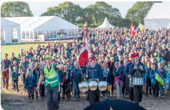
På vej til afslutningslejrål.