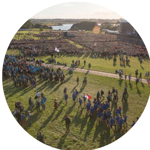
Åbningslejrålet var premieren for Sønderborgs nye sceneområde på Kær Vestermark.

projektleder fra november 2014, en projektassistent fra juni 2015 og fra juni 2016 yderligere tre-fire medarbejdere. Gradvis frem mod lejren blev medarbejdere i flere andre afdelinger i kommunen involveret som en del af deres job.