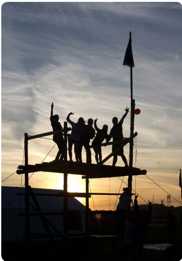
En flok spejdere har en fest på Spejdernes Lejr 2012 i Holstebro.

Til Spejdernes Lejr 2017 ville de danske spejderkorps tage udgangspunkt i erfaringerne fra deres første fælles lejr i Holstebro i 2012 med 37.300 deltagere.