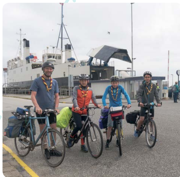
Ankomstdagen til Spejdernes Lejr var den travleste for AlsFærgen nogensinde.

23. august meldte AlsFærgen i en forsideartikel i JyskeVestkysten Sønderborg, at juli havde været færgens største rejsemåned nogensinde, og at Spejdernes Lejr var medvirkende årsag. Ankomstdagen 22. juli havde været den største rejsedag i færgens historie.