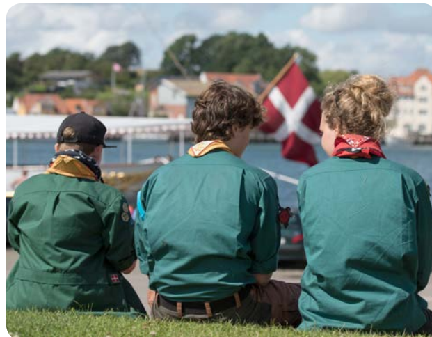
Spejdere nyder udsigten over Sønderborg Havn.

Samtidig fastslog Epinion-målingen, at lejrdeleger og gæster fik et meget positivt indtryk af Sønderborgområdet og var særdeles tilfredse med kommunens værtskab.