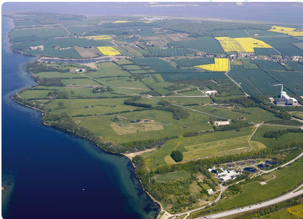
Kær Vestermark, da Sønderborg Kommune købte området.

Kommunen og Danmarks Naturfredningsforening, DN, gav hinanden håndslag på, at området skulle kunne bruges til forskellige former for rekreative aktiviteter til glæde for borgerne og foreninger med respekt for og hensyntagen til naturen. Herunder kunne området benyttes i forbindelse med Spejdernes Lejr 2017. Alligevel opstod i maj usikkerhed, da DN ville gennemføre en fredningssag for området, men kommunen og DN kom i dialog og besluttede at samarbejde om fredningssagen.