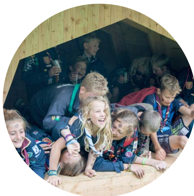
De første shelters blev indviet og straks taget i brug på lejren.

Ud af de 6,6 mio. kr. dækkede de 3,7 mio. kr. poster i kommunens budget for lejren, og dermed var kommunen et godt stykke nærmere sin målsætning om at indhente 6 mio. kr. i ekstern finansiering af værtskabet. Dog skulle der betales fondsmoms, så med 1 mio. kr., som regionsrådet havde givet fra sin kulturpulje, lå kommunen nu på 4 mio. kr. i ekstern finansiering.