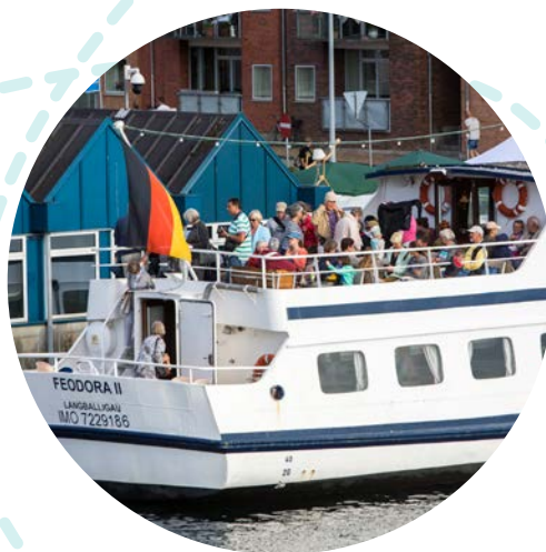
"Feodora II" sejlede ekstra ture, mens Spejdernes Lejr stod på.

I nogle måneder fra august 2016 tilknyttede kommunens Erhvervsservice en konsulent på deltid til at bringe erhverv og turisme ind i eventen med gæster til lejren i fokus. Erhvervsservice og VisitSønderborg arbejdede videre med at skabe turispakker. Der blev blandt andet udbudt ekstra guidede ture i Gråsten Slotshave og ekstra byvandring og sejlture med "Feodora II", og sommerens ugentlige Historisk Ringridning ved Sønderborg Slot blev udvidet til tre dage i uge 30.