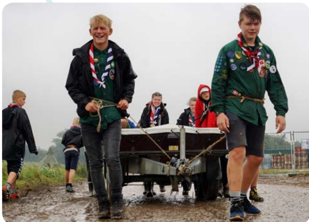
Hjemrejsedagen var ekstra våd, men spejderne ryddede pænt op efter sig på lejrplassen.

Trods udfordringer med skybrud midt på dagen gik afrejsen fra Spejderens Lejr op i den sidste ende. På pladsen var der helt fra morgenstunden fuld aktivitet. Telte, køkkener og pionerarbejde blev brækket ned, materialer blev pænt samlet i bunker, og noget kom i containere.