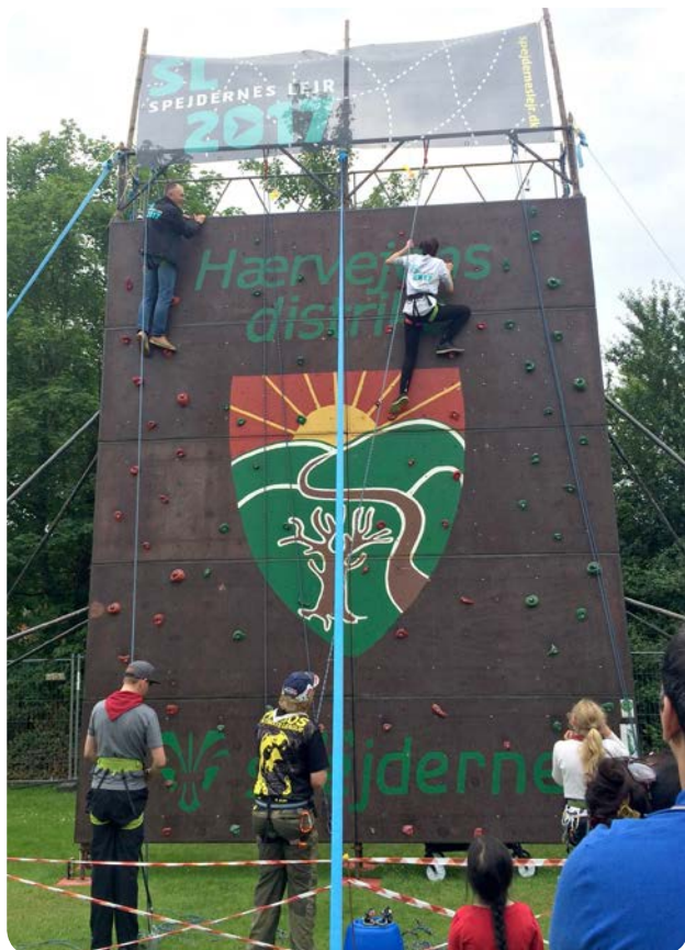
Hærvejens KFUM-spejdere med deres populære klatrevæg.

Blandt andre arrangementer, hvor lejren blev synliggjort, var Destination Sønderjyllands Local Cooking, Gråsten Æblefestival og Fællesdyrskuet i Aabenraa 2017.