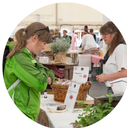
Deltagerne i Spejdernes Lejr brugte i gennemsnit 465 kr. under lejren, lederne på lejren dog godt 1000 kr., mens tilrejsende gæster i gennemsnitligt brugte 575 kr.