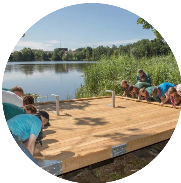
Slotssøen i Gråsten fik ny flydebro bygget af spejdere.

I samarbejde med Gråsten Forum satte spejdere under lejren også et varigt spor i Gråsten. Her havde en tidligere flydebro med bænk i Gråsten Slotssø været savnet i nogle år, og spejdere fra Hjørring og Viborg byggede og søsatte en ny bro i løbet af to dage. Andre to dage havde Gråsten besøg af spejdere fra lejren, som først var på et løb i skoven med fortællinger om historiske steder. Derefter overværede de vagtskiftet på slottet, hvor kongefamilien var på sommerophold, og til sidst var de på Gråsten Landbrugsskole i Den Røde Lade, hvor Kulturlandsbyen6300 havde arrangeret eventyrfortælling, folkedans og maleri.