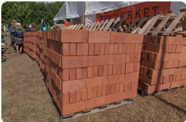
Murstenene, som lejrens spejdere og gæster ridsede navn i, er efter lejren lagt som gulv i vartegnet Støvlen. Så kan lejrdeeltagere vende tilbage og finde deres navn.

På lejren satte spejdere og gæster 9500 spor i teglsten ved aktiviteten "Teglværket". Samtidig var der formidling af teglværkernes betydning i Flensborg Fjordområdet.