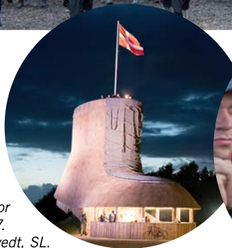
Støvlen – vartegnet for Spejdernes Lejr 2017. Foto: Pernille Bille Tvedt, SL.