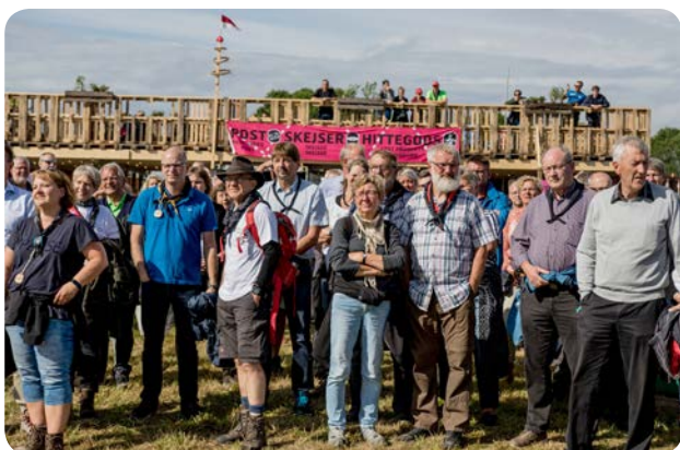
Inden åbningslejrbalet holdt kommunen reception med rundvisning for lokale partnere.

Arrangementet blev tilrettelagt af turismekonsulenten i kommunens Erhvervsservice i samarbejde med projektkontoret.