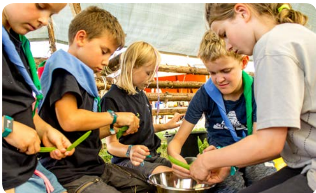
Spejderne er i gang med at lave snysk.

Spejderne godkendte på et lejrledelsesmøde i oktober 2016 Sønderborg Kommunes forslag om at gøre bæredygtighed til et centralt tema. Lejrledelsen godkendte også, at onsdagen på lejren blev Synnejysk Daw med et helt igennem sønderjysk tema. I forvejen var det vedtaget, at lejrdelegerne skulle tilberede og spise egnsretten snysk med lokale råvarer – en af kommunens aktiviteter, hvor landsbylaug var involveret.