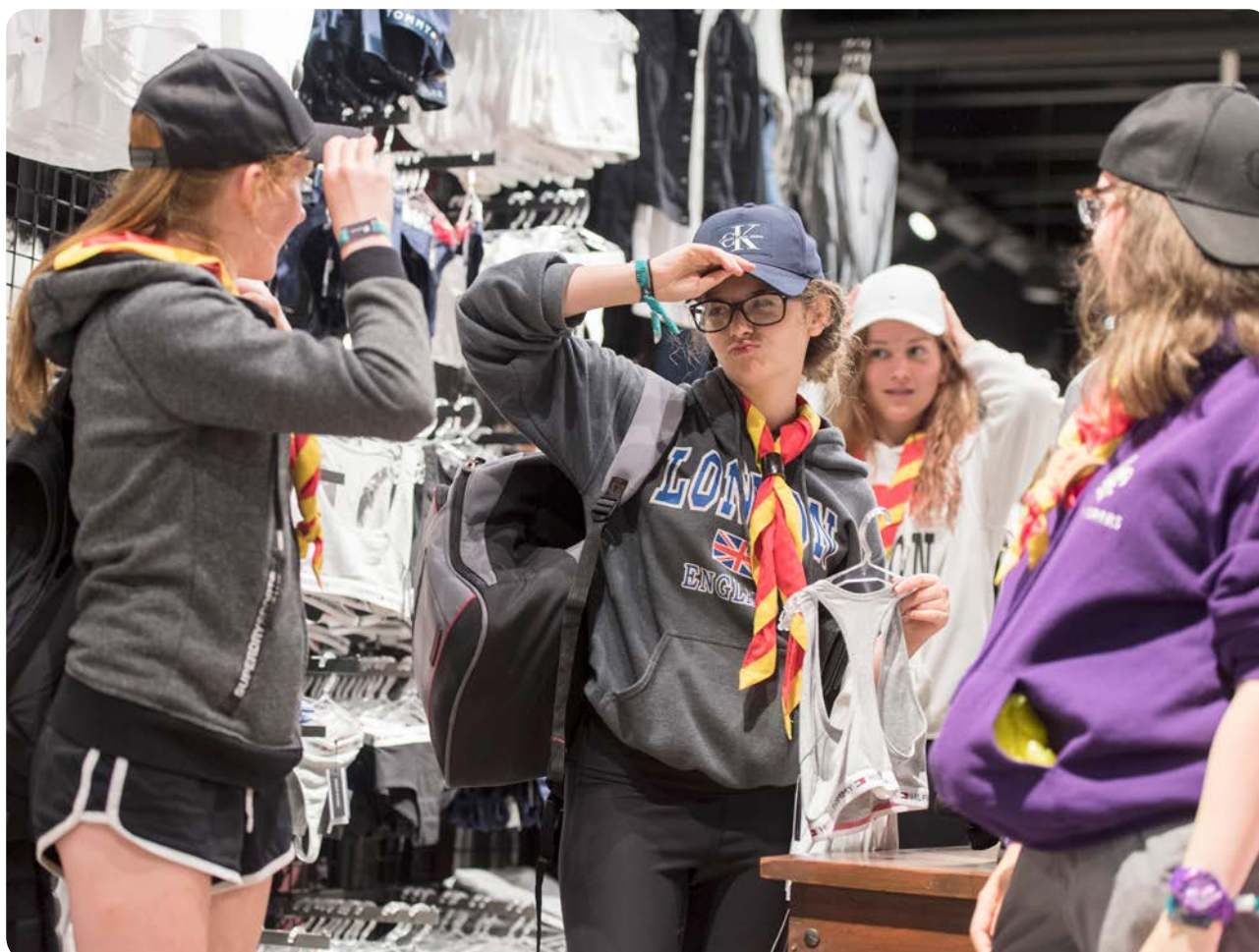
Engelske spejdere på besøg i Sønderborg by.