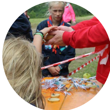
Spejderne lærte om energi i SciSpejd.

Lejren fik navnet Camp Løvkær, og der boede fast ni borgere, mens 11 andre kom på besøg i dagtimerne. De fleste dage besøgte de den store spejderlejr, og ligesom på den store spejderlejr fik de snysk til aftensmad om onsdagen.