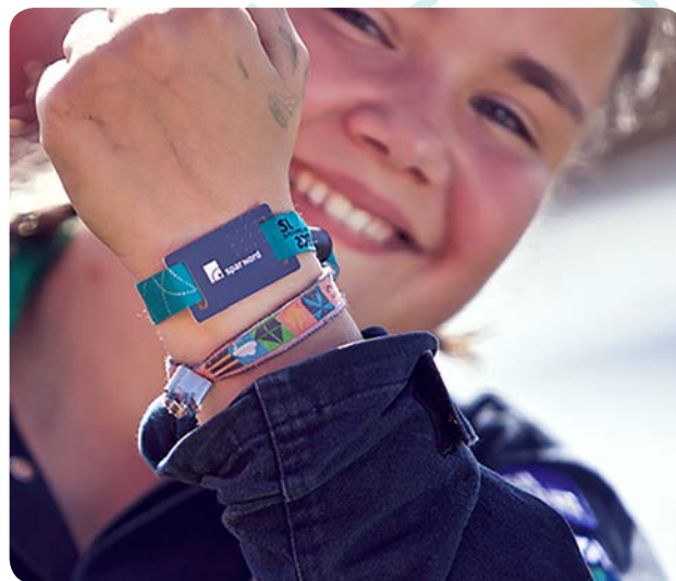
Der blev betalt med "skejser" både i og uden for lejren.

Gæster på lejren kunne købe et særligt betalingskort, mens kontanter kun kunne bruges i begrænset omfang på lejren. Der var ca. 50 butikker uden for lejren, som tilmeldte sig skejser-systemet.