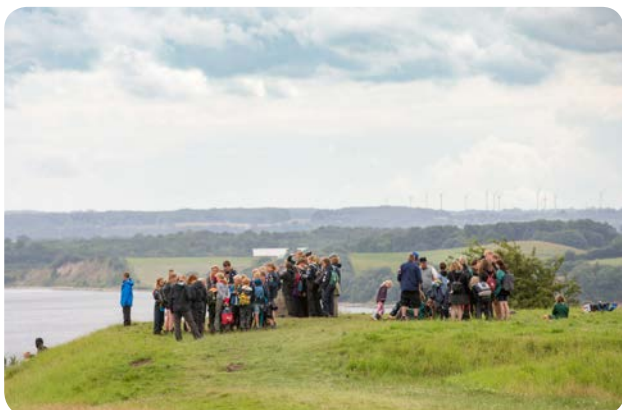
Spejdere i historieaktivitet om 1864-krigen på Dybbøl Banke.

Det har også sat Sønderborg-spor hos borgere, som ikke selv har besøgt lejren eller deltaget i den. Det viser resultatet af en landsdækkende Epinion-undersøgelse efter lejren, som var bestilt af Spejderne, men som Sønderborg Kommune fik nogle spørgsmål med i.