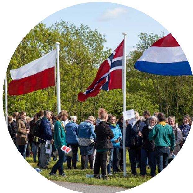
Ved medarbejderfesten blev deltagerne inddelt i store patruljer, som fik hver sin nationalitet, inden de skulle ud på spejderløb.

Som startskud holdt kommunen i maj 2015 en medarbejderfest med spejdertema på Kær Vestermark. Over to aftener deltog ca. 1800 medarbejdere. Lokale spejdere havde forberedt et spejderløb med ti poster som indledning på festen. Deltagerne blev inddelt i hold a 40-50 personer, og så gik det ud i terrænet, hvor de blandt andet skulle bygge en bro kun med raf-ter, lave et kampråb til holdet og riste skumfiduser over bål. Festen sluttede med personalerevy.