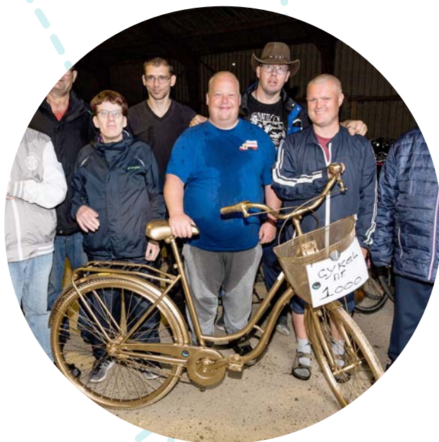
SAABU satte 1000 cykler i stand.

I løbet af foråret 2016 begyndte der at komme form på flere af de aktiviteter til Spejdernes Lejr, der udsprang af lokale partnerskaber.