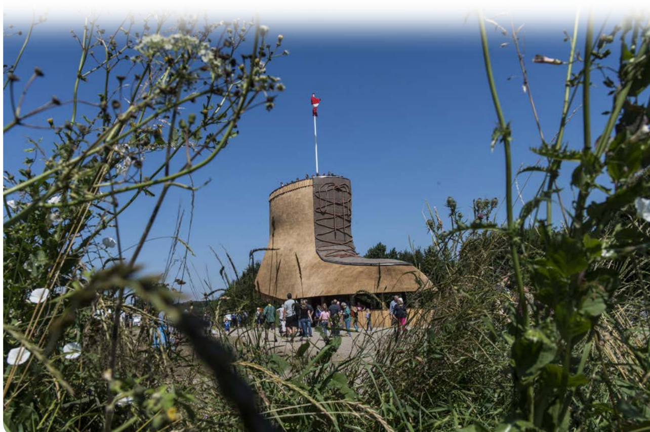
Støvlen har vakt stor opmærksomhed. Den er nu grillhus og udkigstårn på Kær Vestermark.

Hele byggeprocessen for shelters og fugleskjul på lejren skulle spejderne stå for i deres FABtown. De første shelters kom på plads og blev indviet om torsdagen under lejren. Et planlagt projekt med en handicapvenlig fiskebro blev dog ikke realiseret i forbindelse med lejren, da der på det tidspunkt ikke kunne opnås godkendelse fra Kystdirektoratet.