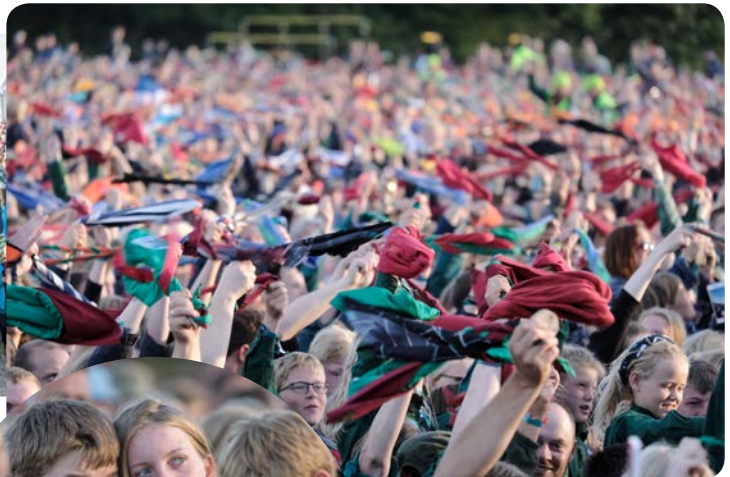
Begejstring ved afslutningslejrål. Tørklæder svinges.