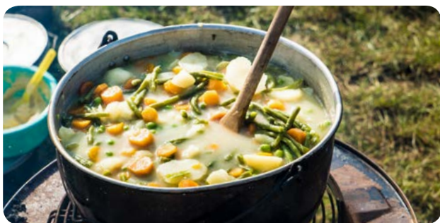
Snysk i gryde over bål.

Det var afprøvningen af et nyt koncept for et lokalt fødevarermarked, der var udviklet i en række workshops som led i kommunens fødevarerstrategi og understøttet af EU-interregprojektet Benefit4Regions. Konceptet skulle efter lejren genbruges ved lokale markeder.