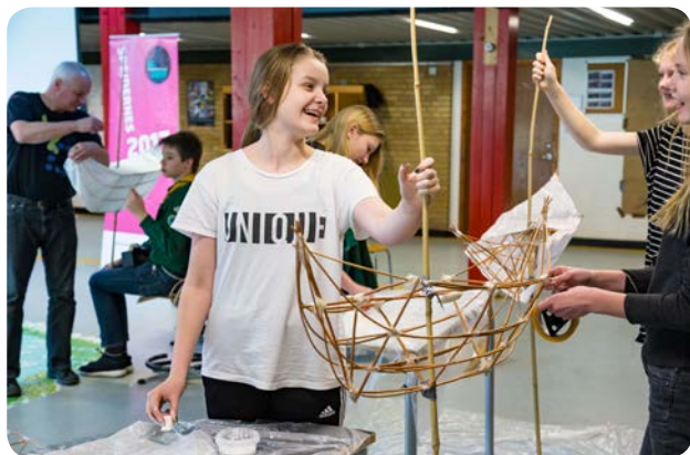
Spejdernes Lejr deltog i åbningen af Kulturhovedstad 2017 i Aarhus, men først skulle bådene lige bygges, og det krævede fingerfærdighed og – især – samarbejde.

I begyndelsen af december 2016 præsenterede kommunen "Eventår 2017 – Sønderborg" ved en happening i Det Sønderjyske Hus. Eventår 2017 var en markedsføringskampagne i anledning af, at kommunen i løbet af året skulle huse en række store, ekstraordinære events såsom Aprilfestival med 800 børneteaterforestillinger, Sternfahrt – et træf for over 3000 frivillige brand- og redningsfolk fra hele Europa – og ikke mindst Spejdernes Lejr i juli.