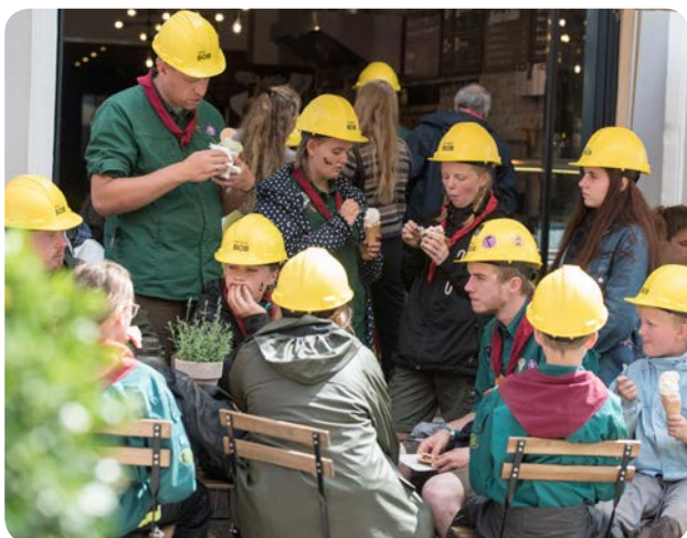
Ikke mindst Sønderborgs isboder havde gode dage under lejren.

Men lejren har ikke kun handlet om pladsen og spejderaktiviteterne. Takket være rigtig mange foreninger, institutioner, handelsdrivende, virksomheder og privatpersoner har der i og rundt om lejren – ja, i hele kommunen – været aktiviteter og tilbud.”