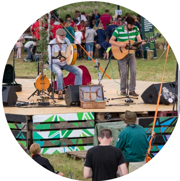
På scenen i midten af Sønderborgs område på lejrens centrale torv spillede flere lokale orkestre. Her er det Downtown Dynt.

Inden lejren uddannede Sønderborg Forsyning op mod 80 lokale spejdere til affaldsambassadører. De blev undervist i tre-fire hold, og de blev på den måde eksperter i sorteringen på lejren, hvor der gjaldt lidt andre regler end i dagligdagen i kommunen.