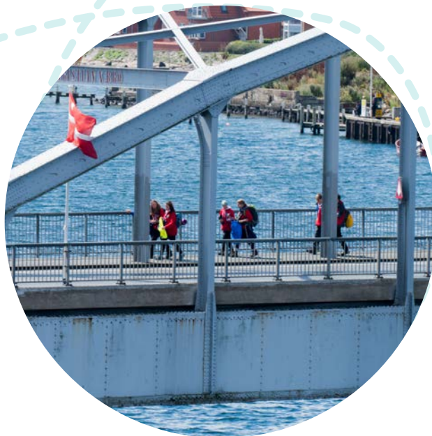
Spejdere på Chr. X's Bro i Sønderborg.

”Spejdernes Lejr satte flotte spor. Søndag formiddag pakker 37.000 spejdere teltene sammen og rejser hjem efter en fantastisk uge i Sønderborg. Strålende stemning i lejren ved Kær. Stærkt forarbejde, der fik stort set alt til at lykkes som planlagt. Og en enestående vitaminindsprøjtning til bybilledet i Sønderborg og turistattraktioner, der har budt velkommen til både spejdere og de mindst lige så mange besøgende, som har benyttet lejligheden til at se nærmere på byen og egnen.”