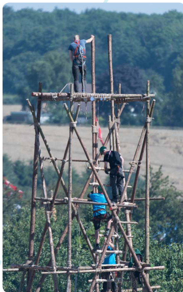
Spejderne byggede højt på Kær Vestermark.

Noget andet var, at det på grund af den fortsat bløde jord ikke var muligt at fjerne alle installationer på Kær Vestermark helt så hurtigt, som det var planlagt, og ifølge biolog i kommunen Bent Albæk var det også gået hårdere ud over terrænet, end frygtet, fordi jorden havde været blød. Dog mente han, at det efter et-to år ikke vil være synligt, at der har været en lejr. Den lejrede jord skulle leveres tilbage til lodsejerne senest 31. august og det var forventet, at langt det fleste "spor" efter SL2017 ville være slettet ved midten af september.