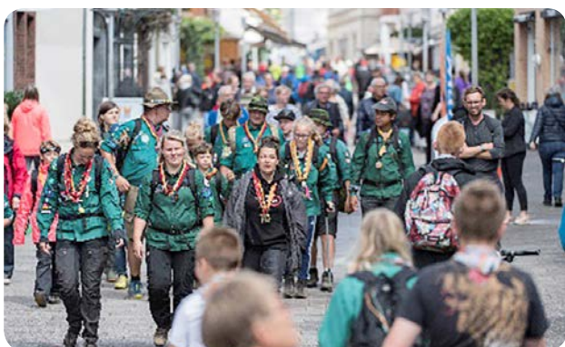
Der var en vrimmel af spejdere i Sønderborg by.