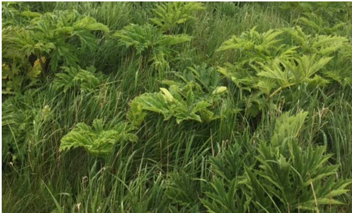
Foto 1. Første bekæmpelse skal være udført inden den 1. maj. Planten har en kraftig vækst i foråret, hvorfor det er vigtigt at starte tidligt, når planterne har to blade og er 10-15 cm høje.

Generelt anbefales det at påbegynde bekæmpelsen tidligt, uanset hvilken bekæmpelsesmetode, der vælges. Ved tidlig indsats er planterne så små, at de er til at håndtere, og succesen ved bekæmpelsen er størst.