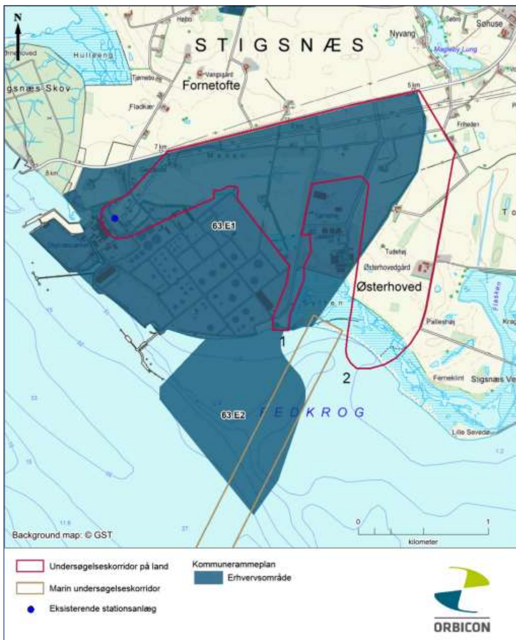
Figur 5.2.1 Kommuneplanrammer