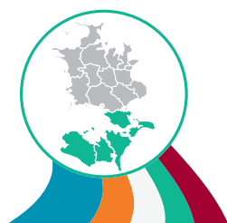
NYKØBING F. KLYNGEN