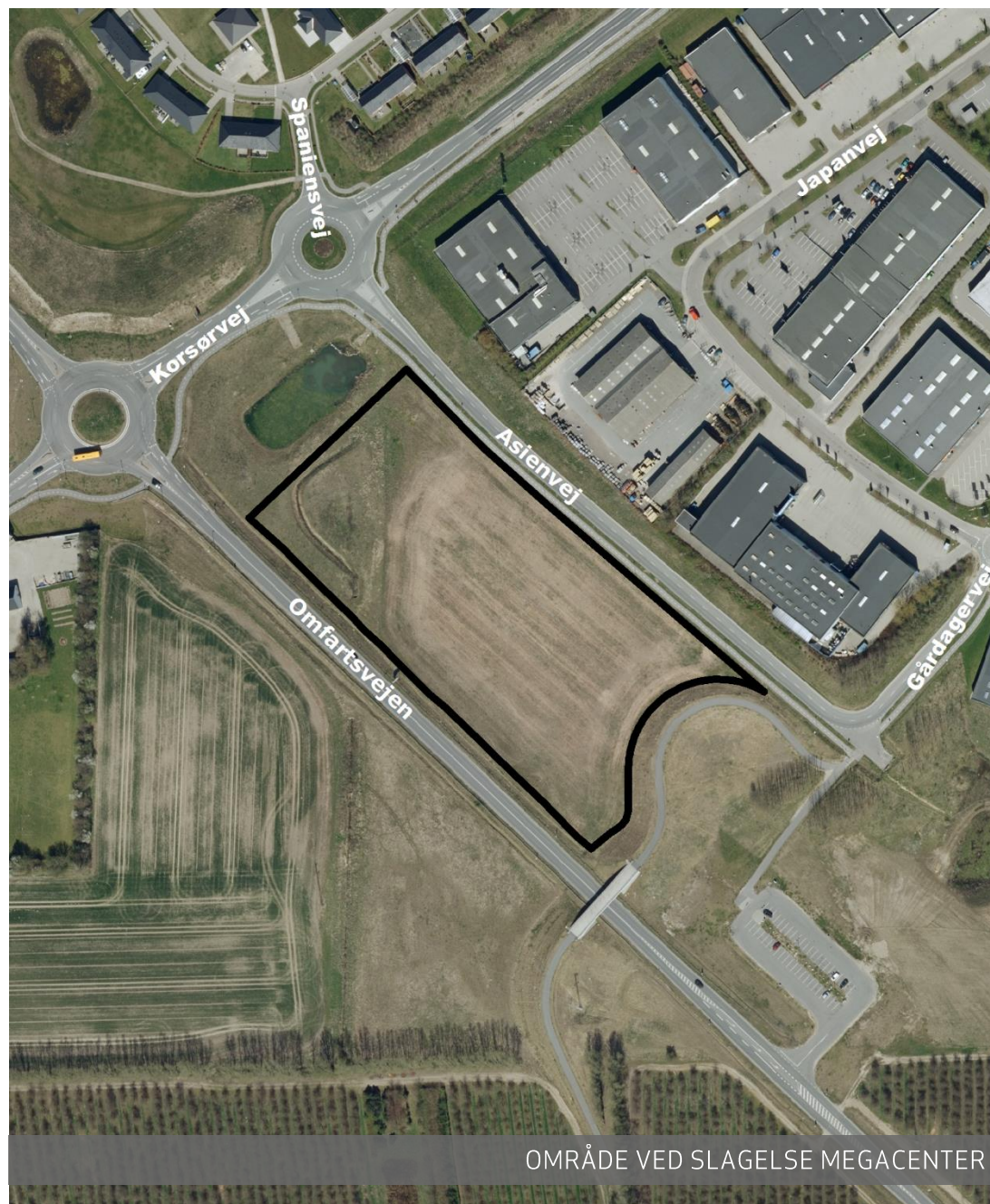
OMRÅDE VED SLAGELSE MEGACENTER

Planforslaget har været fremlagt i offentlig høring fra den 30. juni 2017 til den 28. juli 2017.