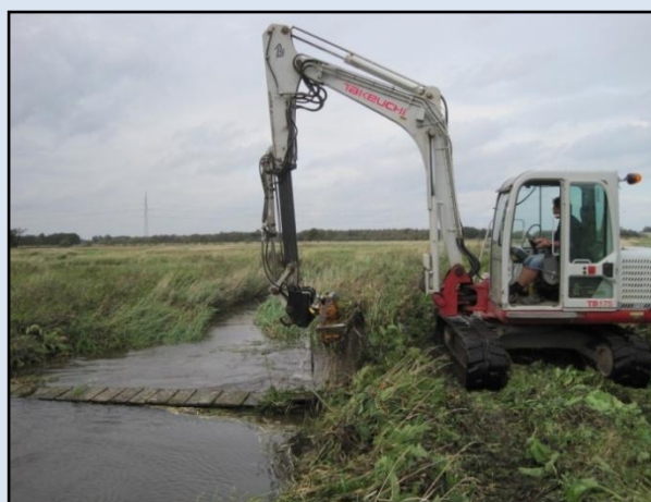
Maskinel grødeskæring med mejekurv