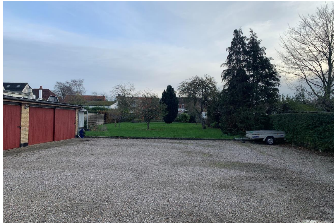
Sådan ser området ud i dag (november 2022).

En lokalplan skal ledsages af en redegørelse, der beskriver baggrunden, formålet og indholdet i lokalplanen. Herudover beskriver redegørelsen de miljømæssige forhold, forsyningsforhold, forhold til anden planlægning, eksisterende forhold i lokalplanområdet, og om gennemførelse af planlægningen kræver tilladelse og/eller dispensation fra andre myndigheder.