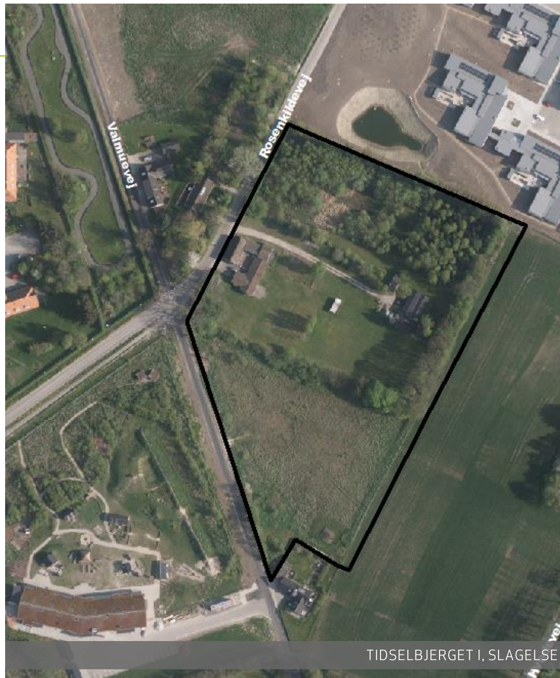
TIDSELBJERGET I, SLAGELSE

Center for Vækst og Plan Rådhuspladsen 11 4200 Slagelse E-mail: plan@slagelse.dk