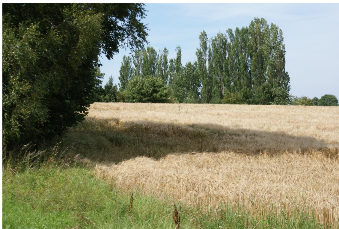
Et kig mod lokalplanområdet, der er en del af det naturskønne 'Tidselbjerget'

En lokalplan skal ledsages af en redegørelse, der beskriver baggrunden, formålet og indholdet i lokalplanen. Herudover beskriver redegørelsen de miljømæssige forhold, forsyningsforhold, forhold til anden planlægning, eksisterende forhold i lokalplanområdet, og om gennemførelse af planlægningen kræver tilladelse og/eller dispensation fra andre myndigheder.