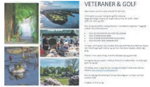
Veteraner og golf.

I 2023 har der deltaget 5-10 veteraner pr. fremmøde.