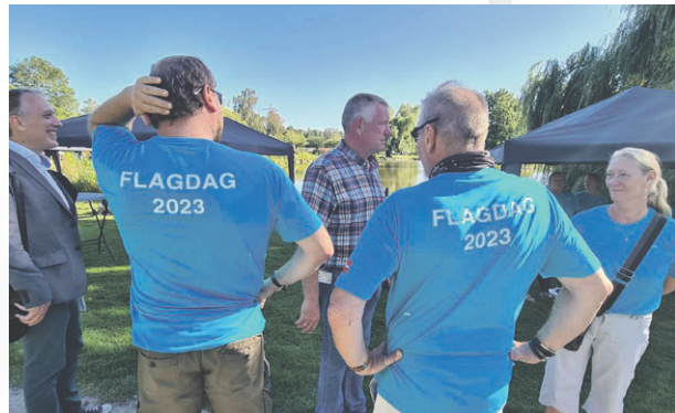
Flagdagen med kolleger.

Der har været mange tilbagemeldinger fra forskellige faggrupper som har været Udsendte for Danmark. Poli, Beredskabsstyrelsen, Præster og Sundhedspersonale har henvendt sig til Veterankoordinatoren for at tilkendegive deres dybe taknemmelighed for, at være blevet talt op og anerkendt på lige fod med andre Udsendte faggrupper såsom soldaterne - på netop denne dag. Mere end nogensinde har Flagdagen 2023 været med til at skabe fornyet fokus og anerkendelse af alle faggrupper, som er Udsendte for Danmark. I slutningen af september 2023 lavede Danmarks Veteraner i samarbejde med Flagdag for Danmarks Udsendte - en undersøgelse af veteranernes holdning til Flagdagen - herunder med fokus på de lokale arrangementer rundt om i de forskellige kommuner. Resultatet forventes i 2024.