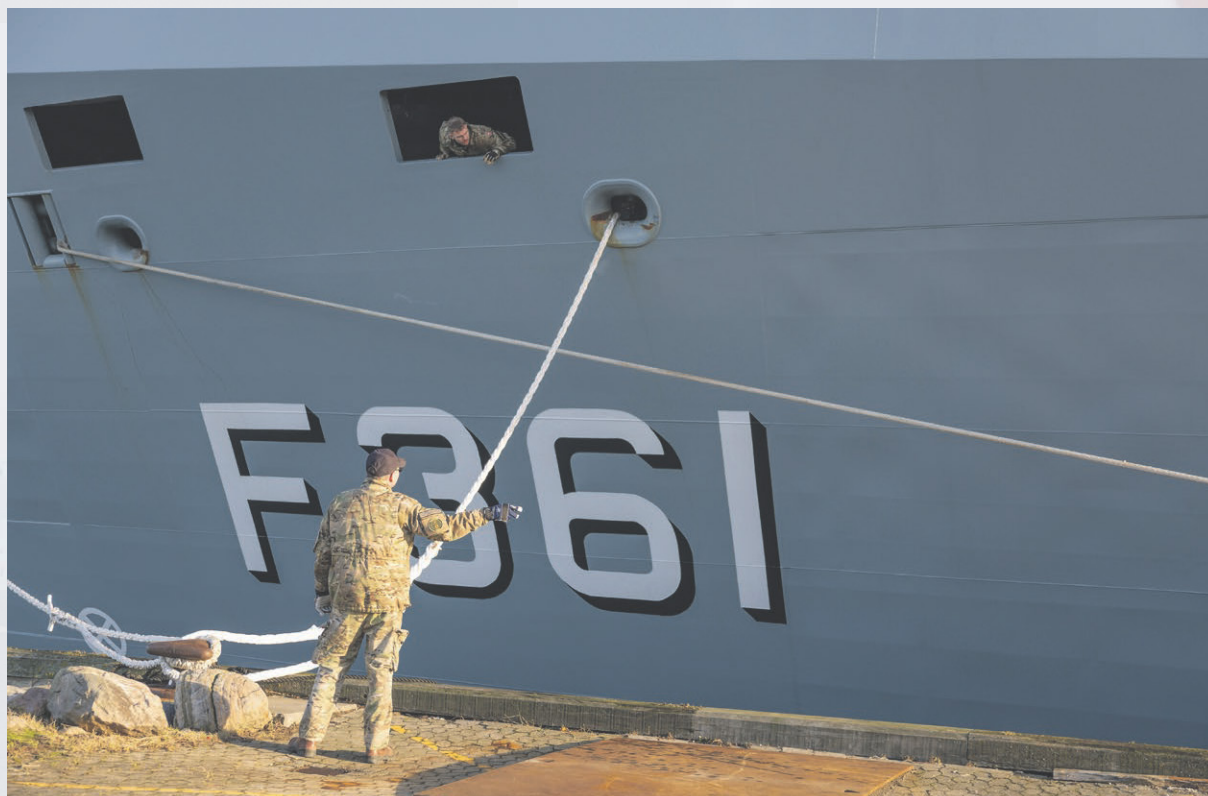
Fregatten Iver Huitfeldt i Flådestation Korsør.

Disse nye forudsætninger gav alt sammen anledning til at starte en proces - i forhold til at retænke og opdatere Veterankoordinator funktionen i Slagelse kommune. Derfor blev der i juni måned 2023 – på baggrund af forskellige hørings svar fra relevante samarbejdspartnere