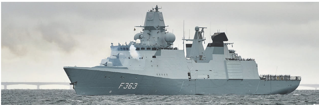
Fregatten Niels Juel saluterer i farvandet ud for Korsør og på Flådestation Korsør.

Der har gennem flere år været et stort ønske om et Veteranhjem i Slagelse i lighed med dem i København, Odense, Fredericia, Århus og Ålborg. Med den nye udmelding i november 2023 om, at der er i næste års finanslov, er afsat fem millioner kroner til at lave et veteranhjem i region Sjælland, som skal drives af Fonden Danske Veteranhjem – blev der atter skabt et håb om at få et fristed til Slagelse for veteraner og pårørende i hele region Sjælland. At få sat Slagelse på landkortet over kommuner med veteranhjem - netop pga. Slagelse som en stor Garnisonsby med både Flådestation Korsør & Gardehusarregimentet og ca. 911 veteraner. Veterankoordinatoren arbejder på, at blive inviteret ind og være med til at kvalificere drøftelserne i processen om beliggenhed og faciliteter mv til det kommende Veteranhjem.