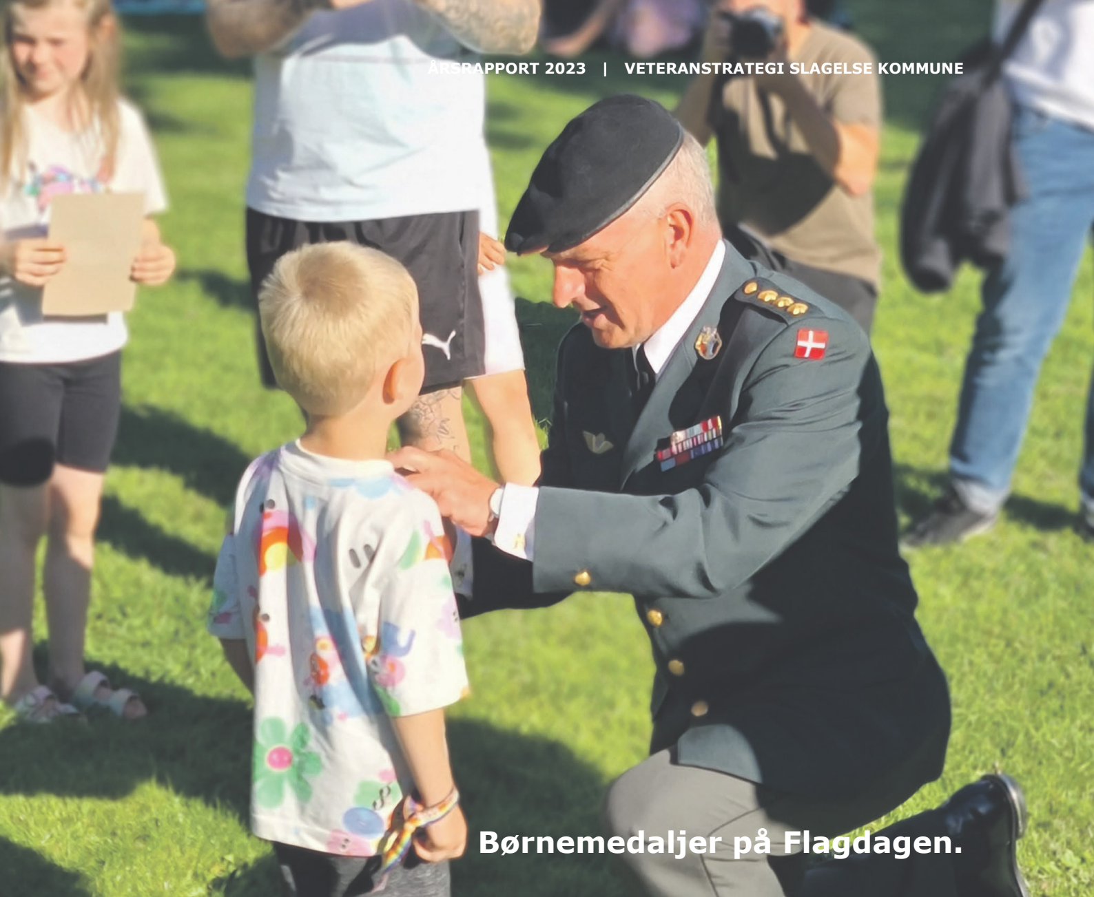
Børnemedaljer på Flagdagen.