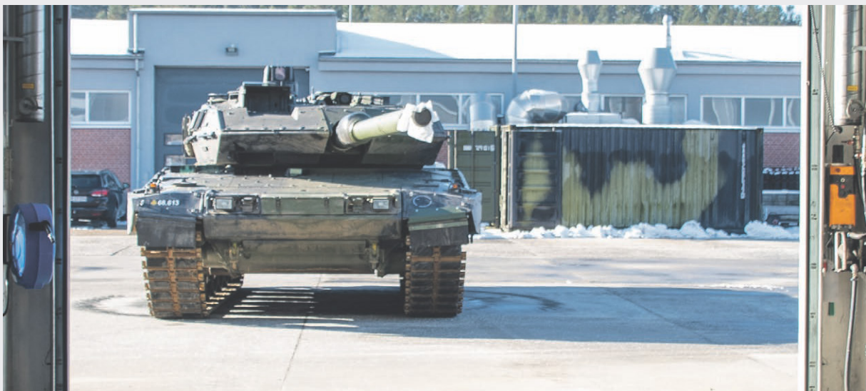
Leopard 2A7 kampvogn på værksted.

Forsvarsministeriet 2022 - Anerkendelse - Evaluering af veteranindsatsen