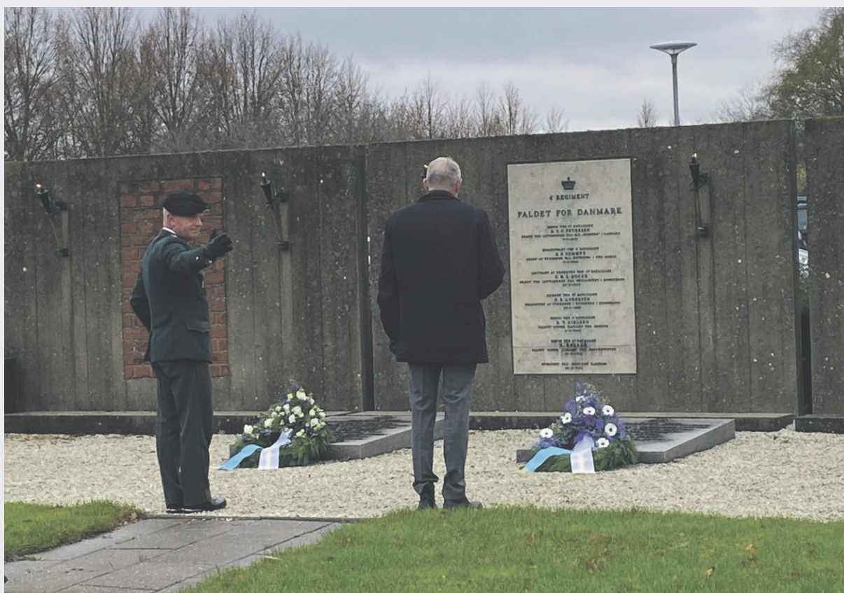
Faldet for Danmark.

Den Nationale Veteran Politik, 2016, Forsvarsministeriet.dk