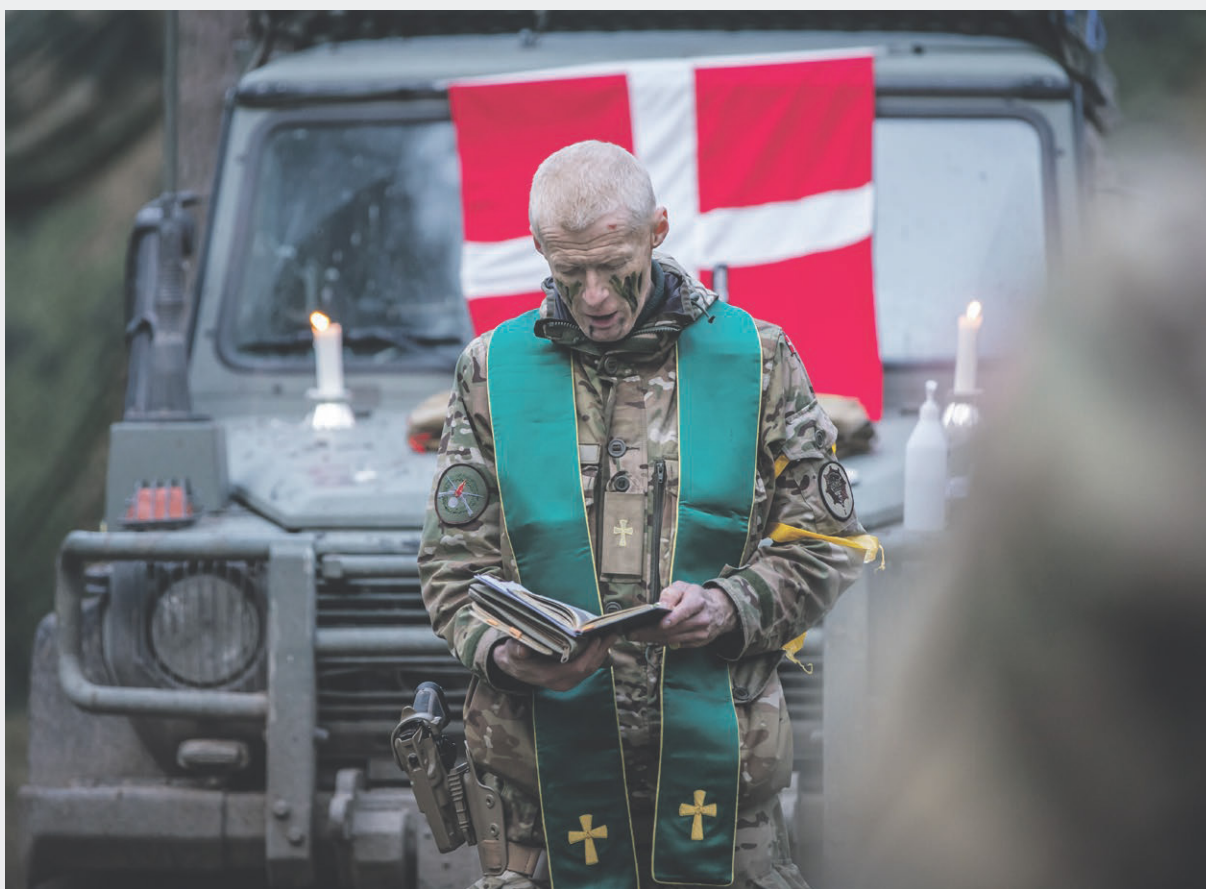
Danske soldater har i 12 måneder været en del af NATOs plan for at forsvare Letland. Som afslutningen på indsættelsen deltog den danske kampbataljon i den store øvelse Crystal Arrow.