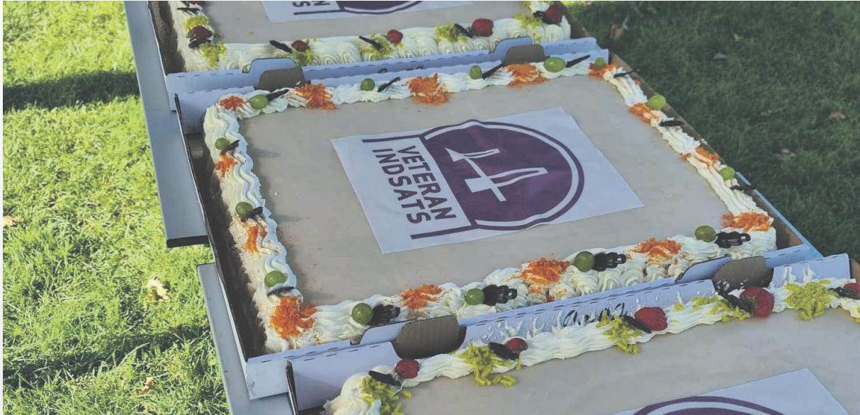
Flagdagen blev naturligvis også markeret med lagkage.

Samarbejdet på tværs af kommuner, frivillige og Forsvaret udvikles fortsat til fælles gavn.