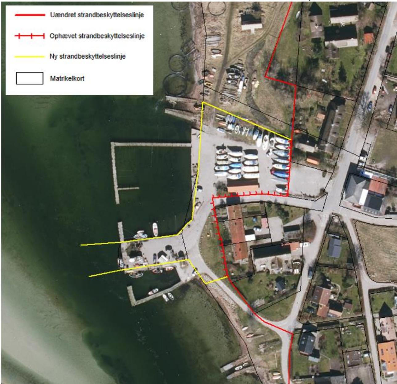
Figur 3. Kortudsnittet viser det nye forløb af strandbeskyttelseslinjen ved Bisserup Havn som fastlagt af Kystdirektoratet.