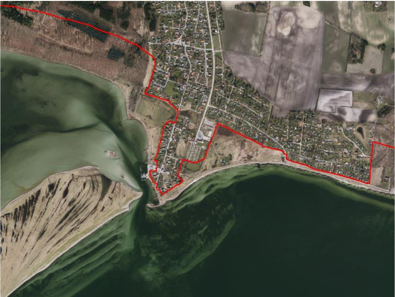
Figur 2. Luffoto 2017 viser Bisserup Havn. Strandbeskyttelseslinjen er markeret med rød.

To ejere af ejendomme på Bisserup Havnevej har i forbindelse med en høring foretaget af Slagelse Kommune forud for ansøgningen bemærket, at en ophævelse af strandbeskyttelseslinjen kan bevirke tab af udsigt og forringelse af det bevaringsværdige miljø og naturen omkring havnen.