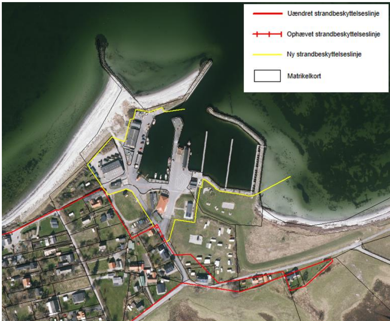
Figur 3. Kortudsnittet viser det nye forløb af strandbeskyttelseslinjen ved Omø Havn som fastlagt af Kystdirektoratet.