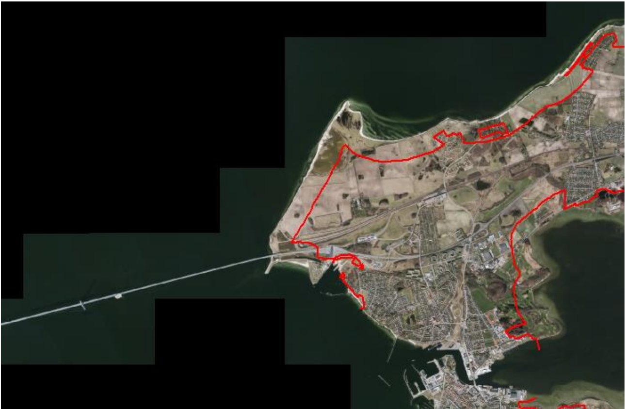
Figur 2. Luffoto 2017 viser Halsskov Havn midt i billedet. Strandbeskyttelseslinjen er markeret med rød.

Det ansøgte areal er ikke omfattet af naturfredning efter naturbeskyttelseslovens kapitel 6.