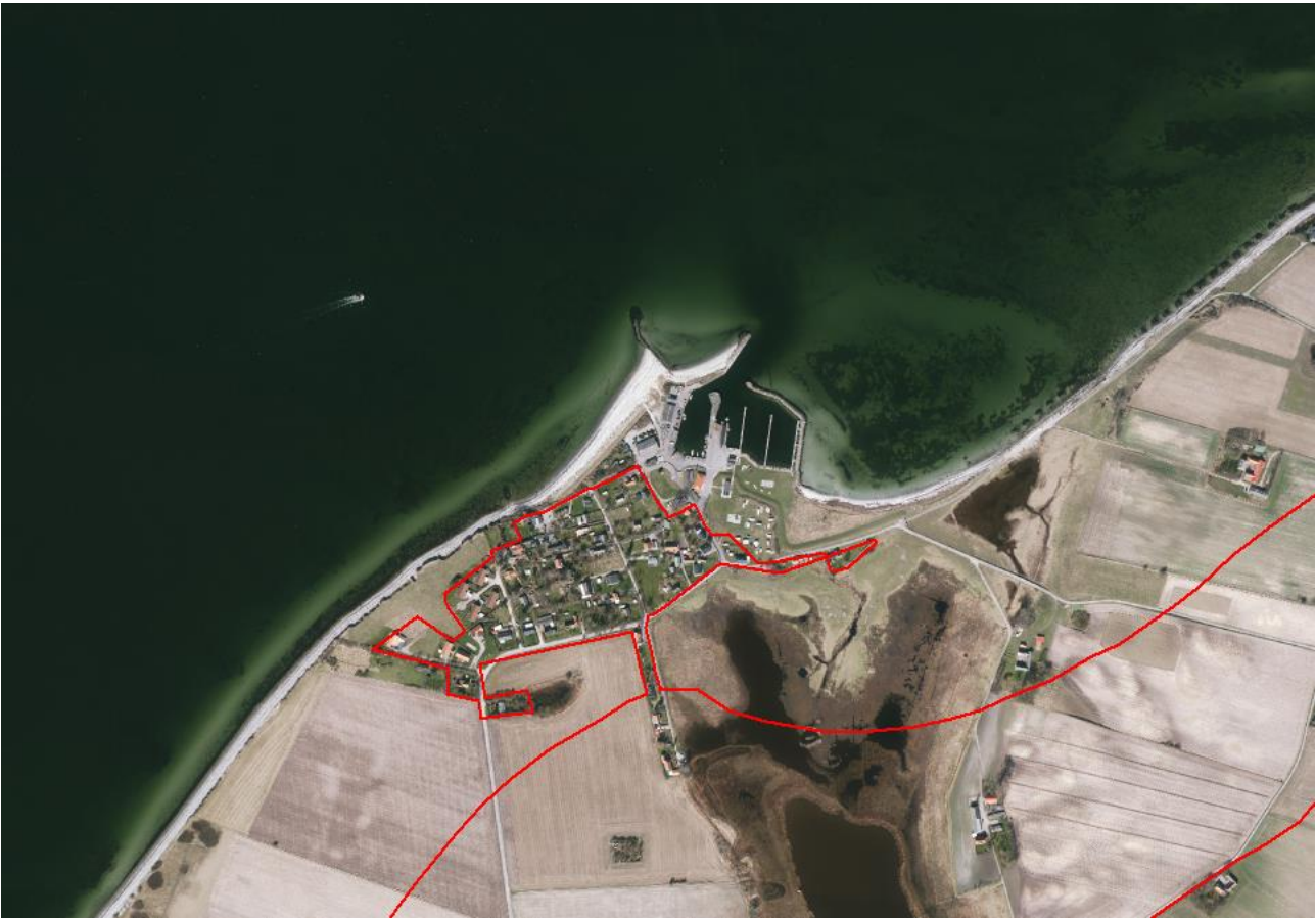
Figur 2. Luffoto 2017 viser Omø Havn. Strandbeskyttelseslinjen er markeret med rød.

En række beboere på Omø Havnevej har i forbindelse med en høring foretaget af Slagelse Kommune forud for ansøgningen bemærket, at de ønsker den nuværende strandbeskyttelseslinje bevaret for at sikre, at eventuelle ændringer i områdets bebyggelse vurderes af en uvildig instans.