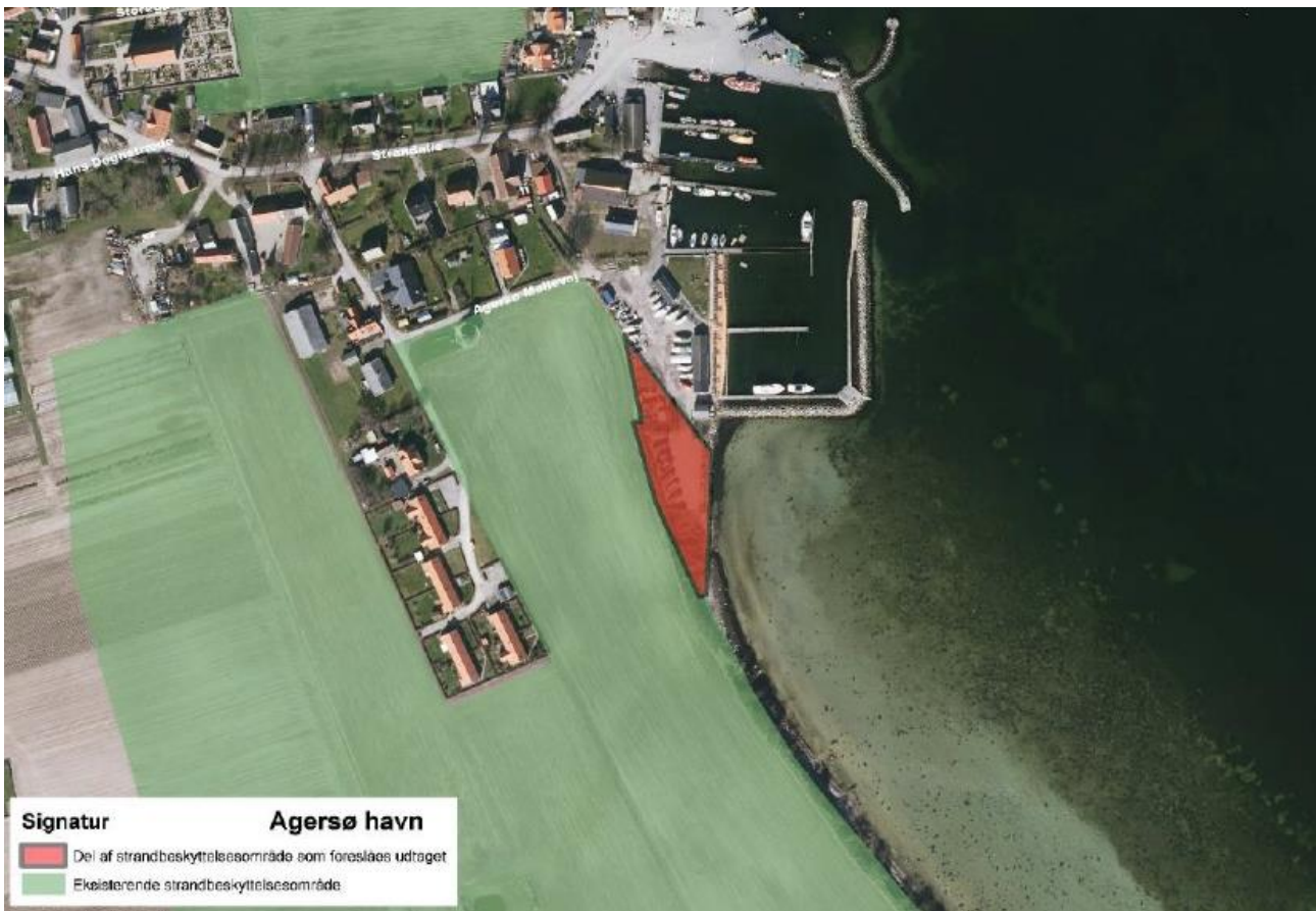
Figur 1. Kortudsnittet viser Slagelse Kommunes forslag til ophævelse af strandbeskyttelseslinjen ved Agersø Havn markeret med rød farve.

Slagelse Kommune har ansøgt om ophævelse af strandbeskyttelseslinjen på et areal ved Agersø Havn, se figur 1.