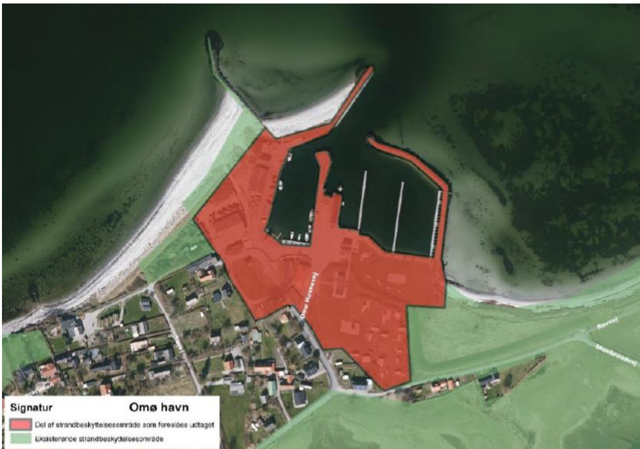
Figur 1. Kortudsnittet viser Slagelse Kommunes forslag til ophævelse af strandbeskyttelseslinjen på og ved Omø Havn markeret med rød farve.

Slagelse Kommune har ansøgt om ophævelse af strandbeskyttelseslinjen på arealer på og ved Omø Havn, se figur 1.