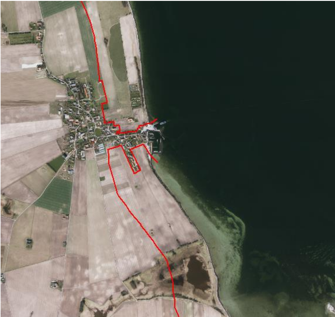
Figur 2. Luffoto 2017 viser Agersø Havn midt i billedet. Strandbeskyttelseslinjen er markeret med rød.

Det ansøgte areal er ikke omfattet af naturfredning efter naturbeskyttelseslovens kapitel 6.