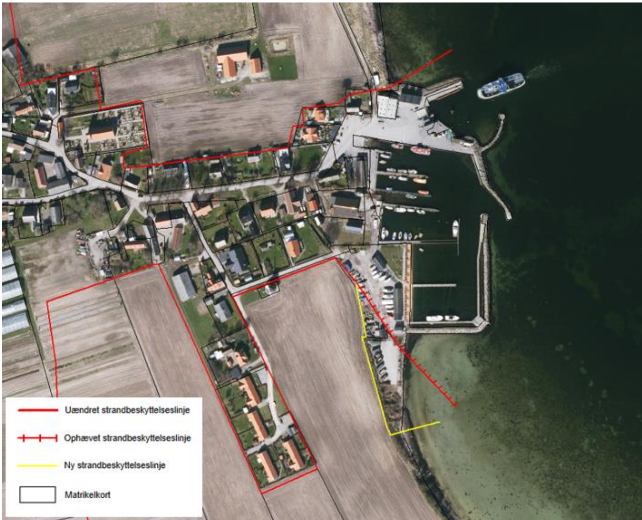
Figur 3. Kortudsnittet viser det nye forløb af strandbeskyttelseslinjen ved Agersø Havn som fastlagt af Kystdirektoratet.