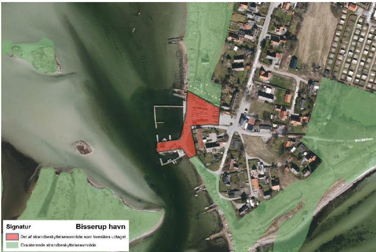
Figur 1. Kortudsnittet viser Slagelse Kommunes forslag til ophævelse af strandbeskyttelseslinjen på og ved Bisserup Havn markeret med rød farve.

Slagelse Kommune har ansøgt om ophævelse af strandbeskyttelseslinjen på et areal på og ved Bisserup Havn, se figur 1.