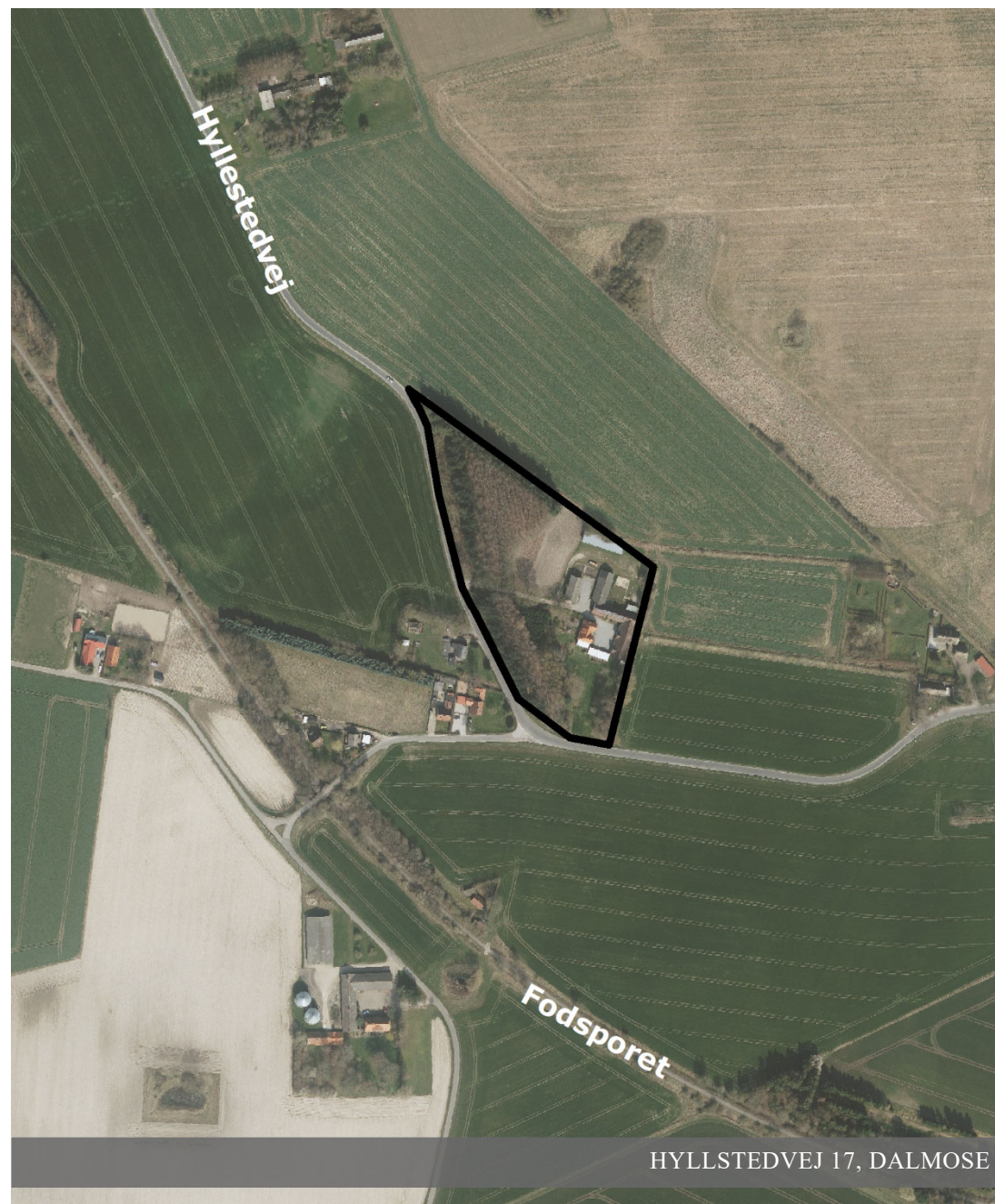
HYLLSTEDVEJ 17, DALMOSE

Slagelse Kommune har modtaget i alt 2 bemærkninger inden for høringsfristen.