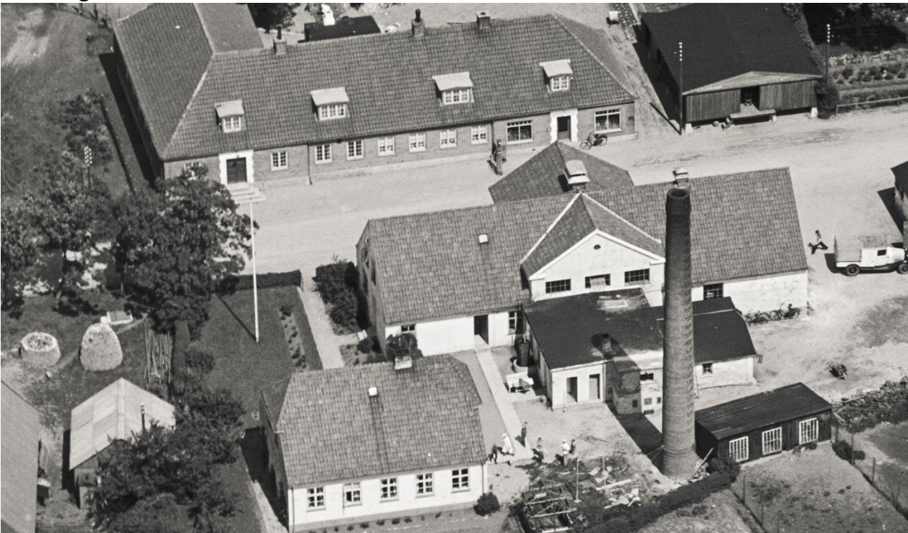
Detalje/bagside af mejeri samt facade af forsamlingshus/butik. DK set fra luften, 1950.