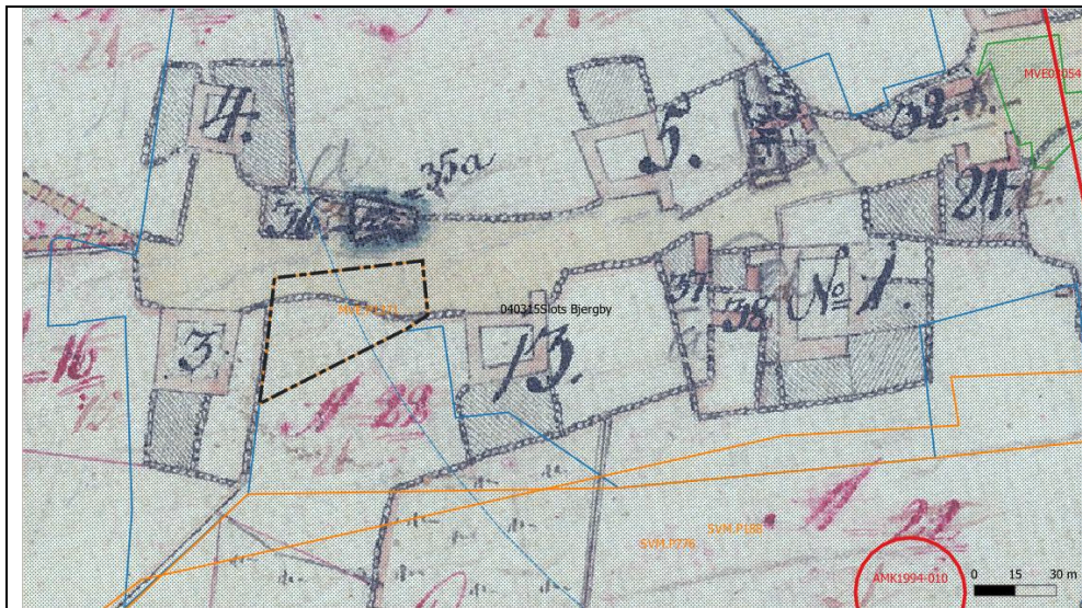
Figur 1. Arealet jf. signaturforklaring i kortbilag. Baggrund: Ældste matrikelkort.

Arealet ligger indenfor det udpegede kulturarvsareal omkring slots bjergby med betydelige arkæologiske interesser.