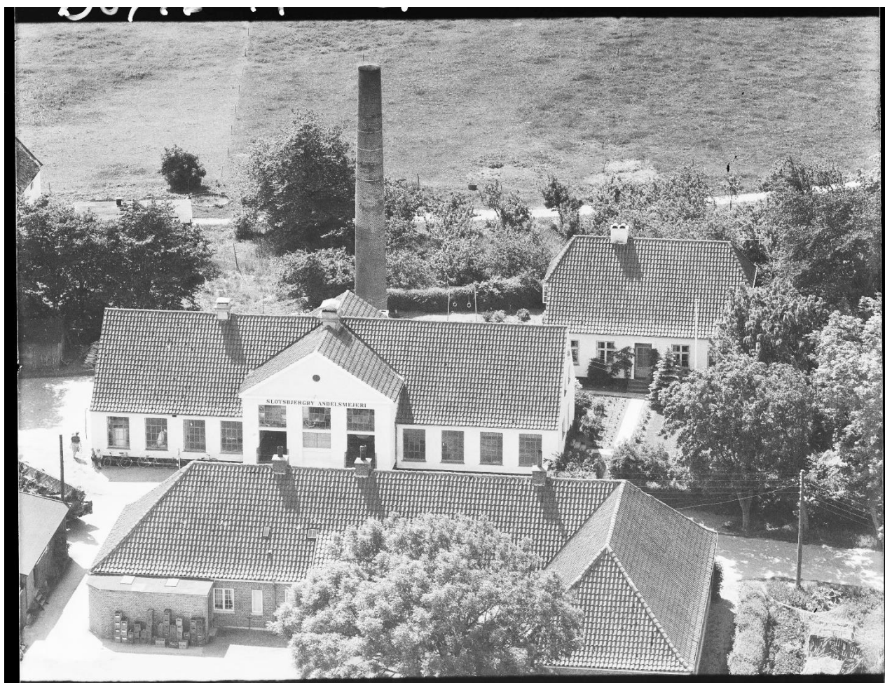
Slotsbjergbygade 37. 1959, DK set fra luften.