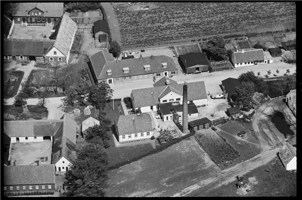
Overblik - DK set fra luften, 1950.