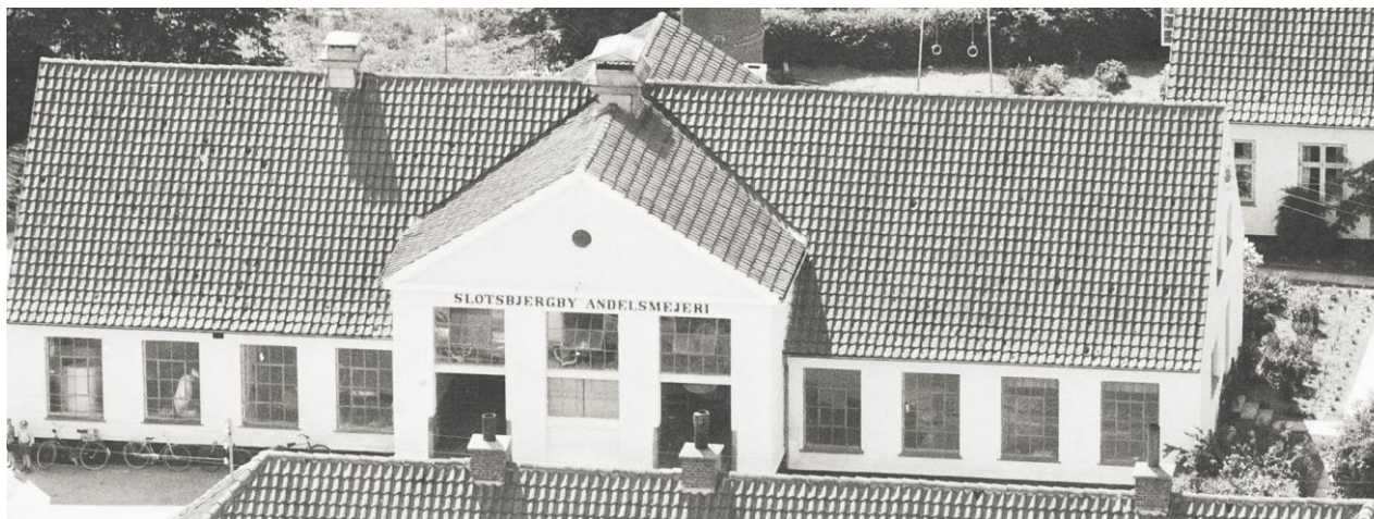
Detalje/facade, Slotsbjergbygade 37. DK set fra luften, 1959