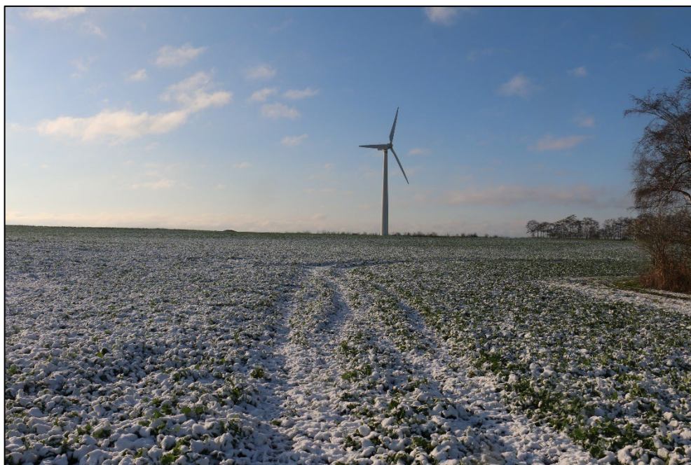
Figur 3-20 Diget angivet på Danmarks Miljøportal kunne ikke lokaliseres under besigtigelsen d. 14. januar 2021.