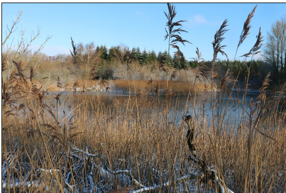
Figur 3-13 Søen set fra sydvest. Søen er langs kanterne omgivet af tæt opvækst af tagrør.