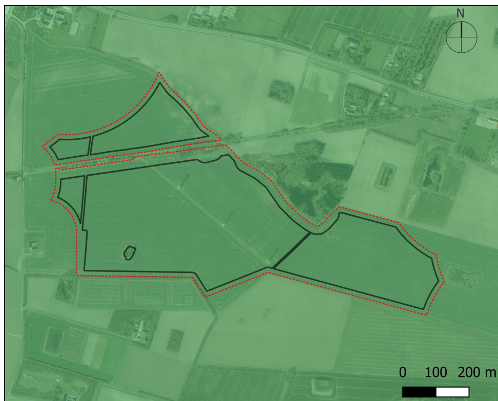
Figur 3-4 Plan- og projektområde (rød streg) med byggefelter (sorte streger), samt arealer, der er udlagt til positive skovrejsningsområde (grøn) jf. Slagelse Kommunes Kommuneplan 2021. Kort fra Danmarks Miljøportal.