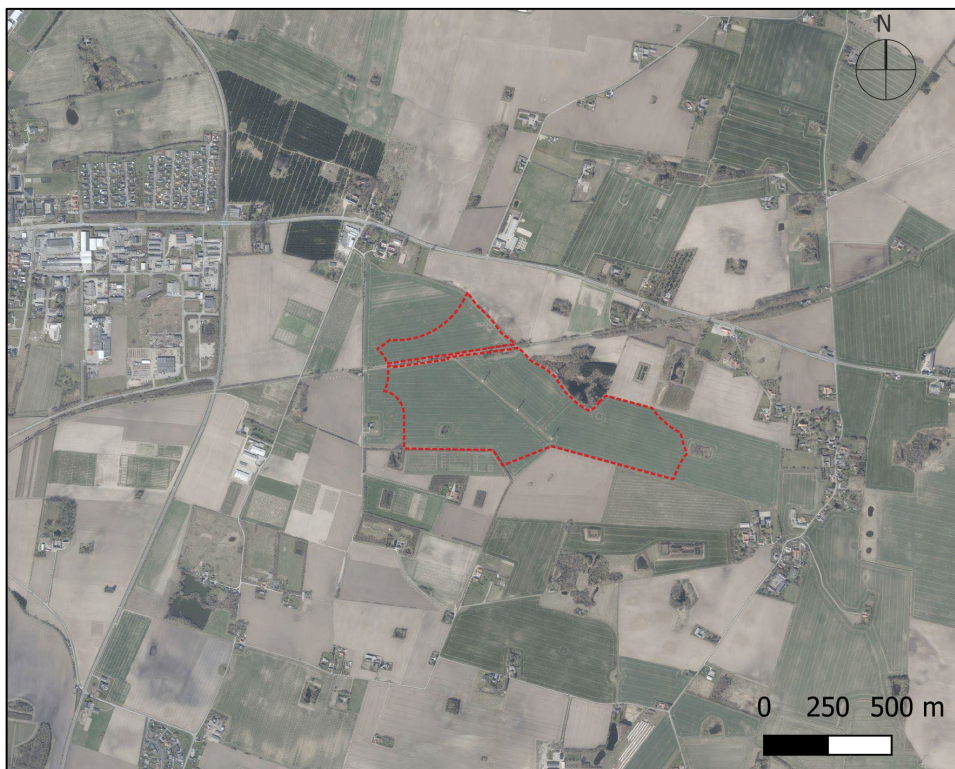
Figur 3-1 Plan- og projektområde. Den røde streg angiver afgrænsning af lokalplanområdet. Delområde 1 er beliggende nord for den tværgående cykelsti, mens delområde 2 ligger syd herfor. Kort fra Danmarks Miljøportal.