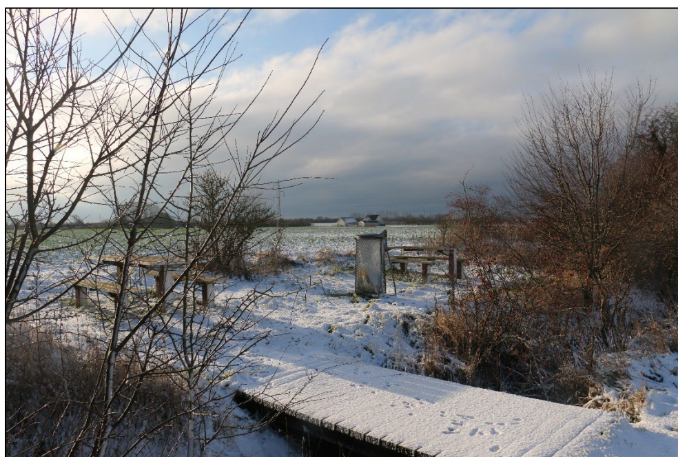
Figur 3-7 Et bord- og bænkesæt er placeret syd for den tværgående cykelsti.