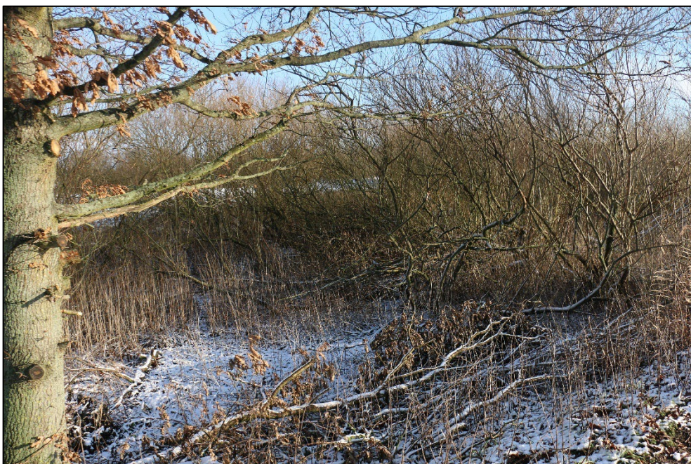
Figur 3-10 Flere steder fremstår mosen som fugtigt krat med opvækst piletræer, birk og rød el.

Der var flere spor efter hare og rådyr i mosen og under besigtigelsen blev der observeret forekomst af 8 rådyr i umiddelbar nærhed af moseområdet.