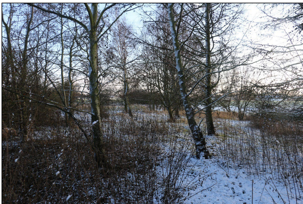
Figur 3-16 Vildtremissen omfatter et træbevokset areal med bøg, rød el og lærk.