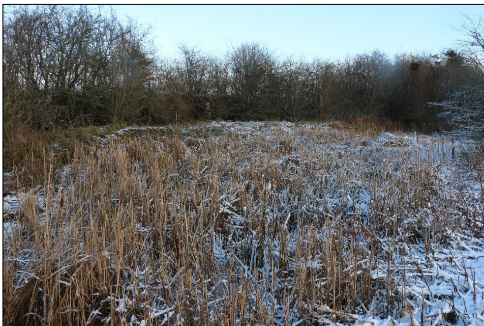
Figur 3-9 Vandhullet er omgivet af fugtigt krat primært bestående af pil.

Anbefaling: Vandhullet bør ikke udsættes for væsentlig/yderligere skyggepåvirkning. Der bør derfor holdes en respektafstand på minimum 10 m til vandhullets sydside. Det anbefales generelt at kvaliteten af vandhullet øges ved at fortage rørskær og oprensning heraf. Vandhullet vurderes i sin nuværende tilstand ikke at være egnet til padder.