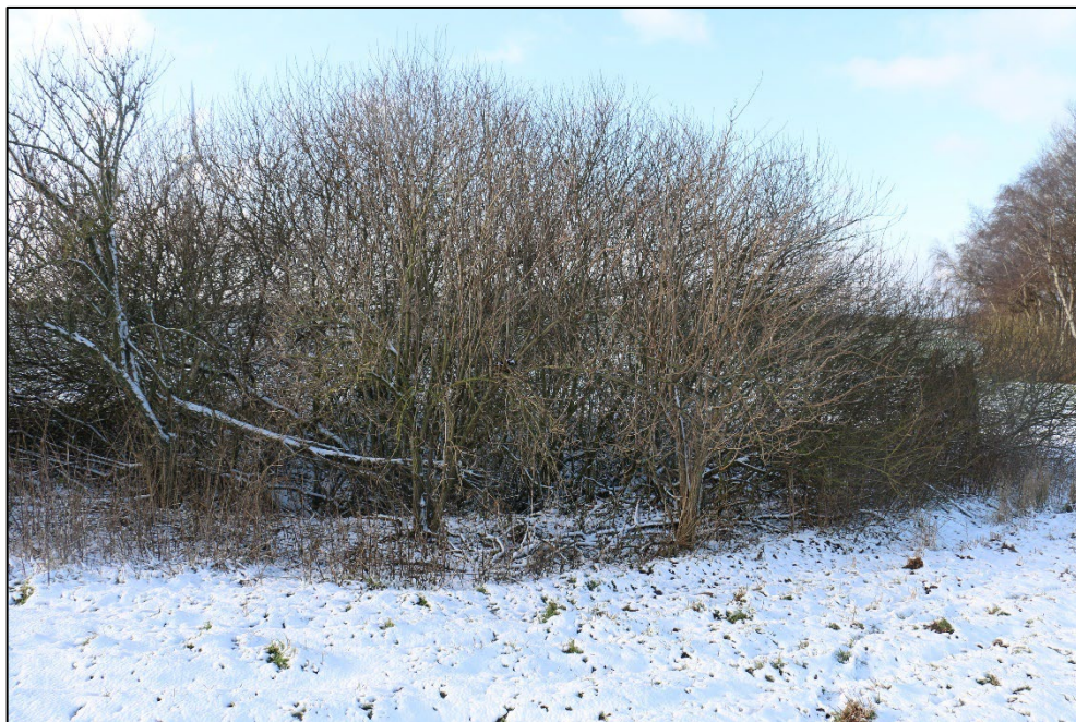
Figur 3-14 Vandhullet var helt tilgroet med pil. Vandhullet vurderes pga. sin størrelse ikke at være omfattet af naturbeskyttelseslovens § 3.

Ved COWIs gennemgang af arealet d. 14. januar 2021 kunne det konstateres, at der er tale om et mindre vandhul, som var overgroet med pil. Vandhullet havde meget lille, åbent vandspejl og stejle skrænter. Vandhullet vurderes at være for lille til at leve op til kriterierne for at opnå beskyttelse efter naturbeskyttelseslovens § 3 og vurderes ikke at være egnet som ynglevandhul for padder (Figur 3-14).