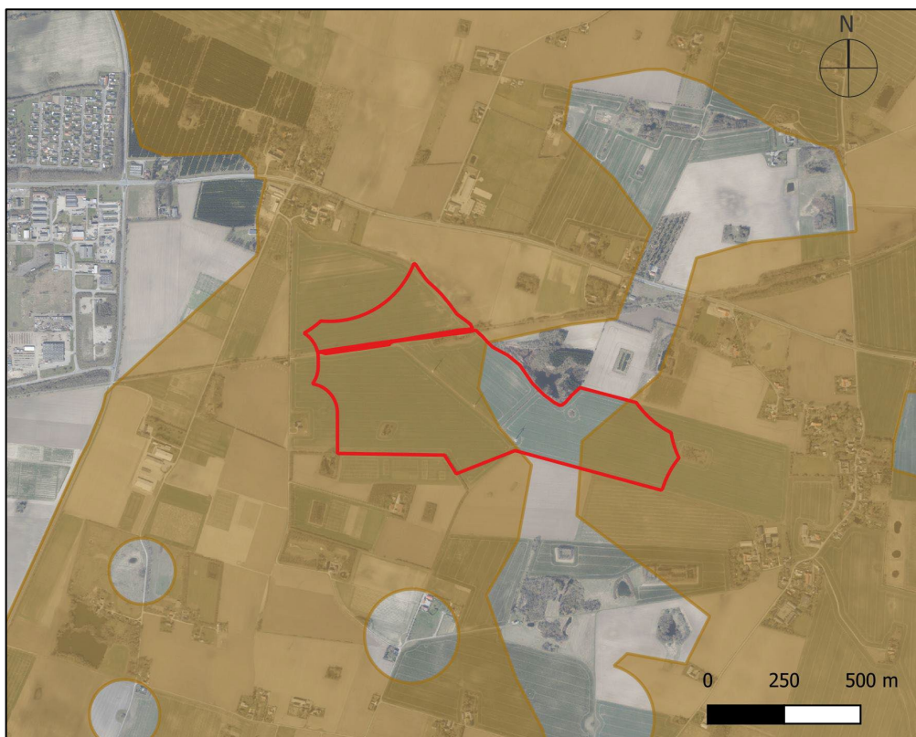
Figur 3-3 Plan- og projektområde (rød streg) samt arealer, der er udlagt til særlig værdifulde landbrugsområder (brun) jf. Slagelse Kommunes Kommuneplan 2021. Kort fra Danmarks Miljøportal.

6.2.3 Ved inddragelse af landbrugsjord til byvækst, tekniske anlæg samt ferie- og fritidsformål skal der i videst muligt omfang tages hensyn til de berørte landbrugsejendommers struktur- og arronderingsforhold samt til arealbehov, investeringsniveau og mulighederne for jordfordeling.