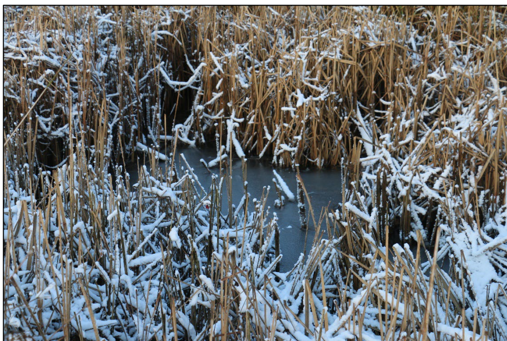
Figur 3-8 Vandhullet S02S. Vandhullet fremstår overvokset med kær-star og smalbladet dunhammer.

Ved COWIs besigtigelse d. 14. januar 2021 blev det observeret, at vandhullet overvejende var dækket af smalbladet dunhammer og kær-star, mens den frie vandflade var meget lille. Vandhullet fremstod tydeligt næringspåvirket, men var lysåbent mod syd. Vandhullet var omgivet af fugtigt krat primært bestående af pil. Vandhullet vurderes i sin nuværende tilstand ikke at være paddeegnet. Krattet nær vandhullet rummer flere skydetårne og fodertønder. Vandhullet og de omkringliggende arealer kan ses på nedenstående fotos (Figur 3-8 og Figur 3-9).