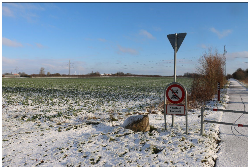
Figur 3-6 Delområde 1 set fra vest. Et mindre læhegn afgrænser arealet fra den tværgående cykelsti.