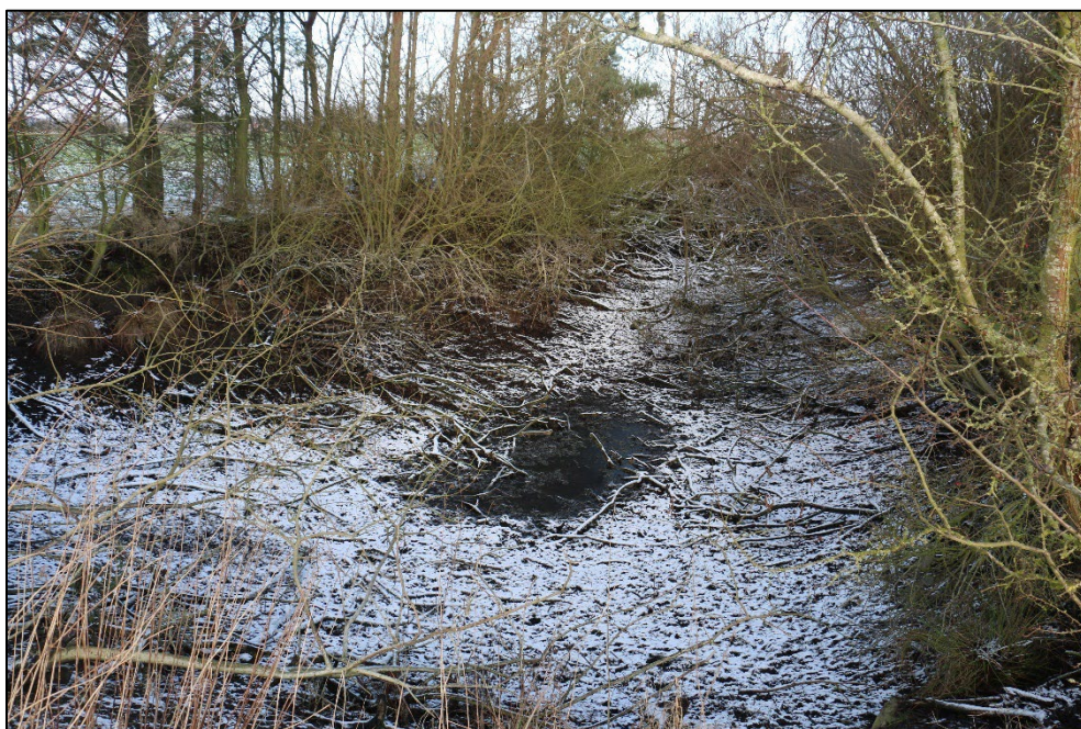
Figur 3-19 Søen fremstod med meget lille vandspejl ved besigtigelsen, som var delvis dækket af liden andemad.