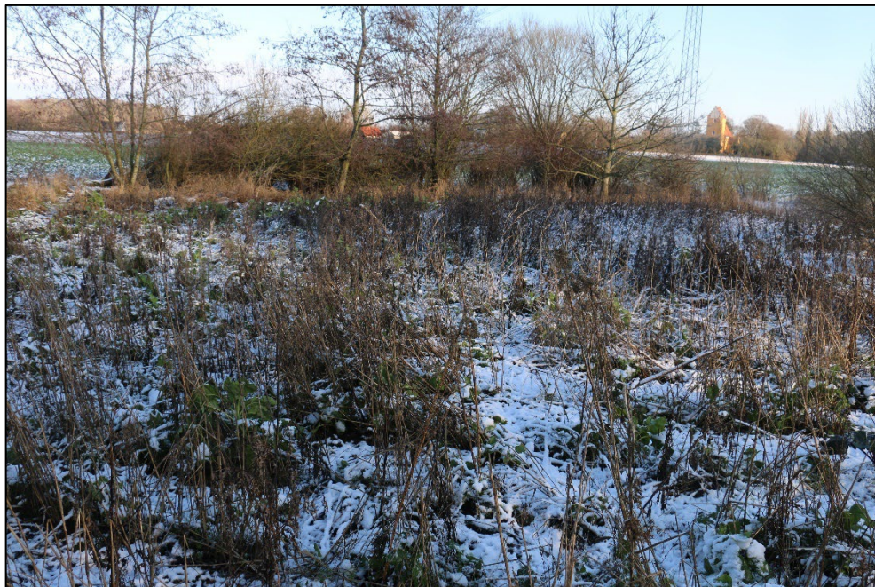
Figur 3-17 I den vestlige del af vildremissen findes en mindre vildt-ager med bl.a. lucerne.