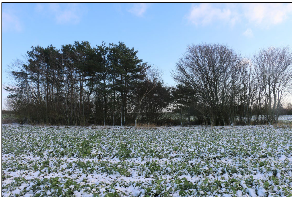
Figur 3-18 Søen set fra vest. Søen er omgivet af høje træer i form af bl.a. fyr og gråpil.