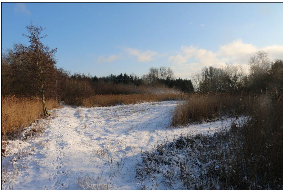
Figur 3-11 Andre steder er mosen mere lysåben med større partier med tagrør. Der er slået flere stier ind igennem moseområdet, hvor der er tydelige tegn på aktivitet af rådyr og hare.