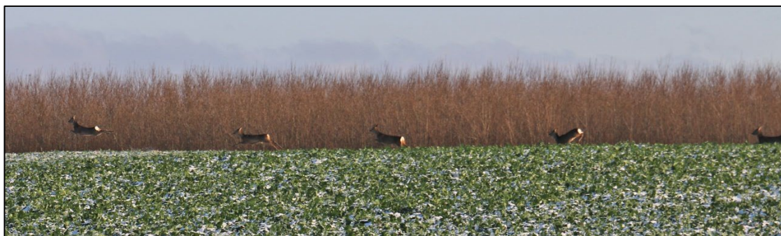
Figur 3-21 Der blev under besigtigelsen observeret både rådyr, hare, fasan og agerhøne på arealet ligesom der blev fundet en del spor efter rådyr og hare, som viser, at der er stor aktivitet af disse arter i området.