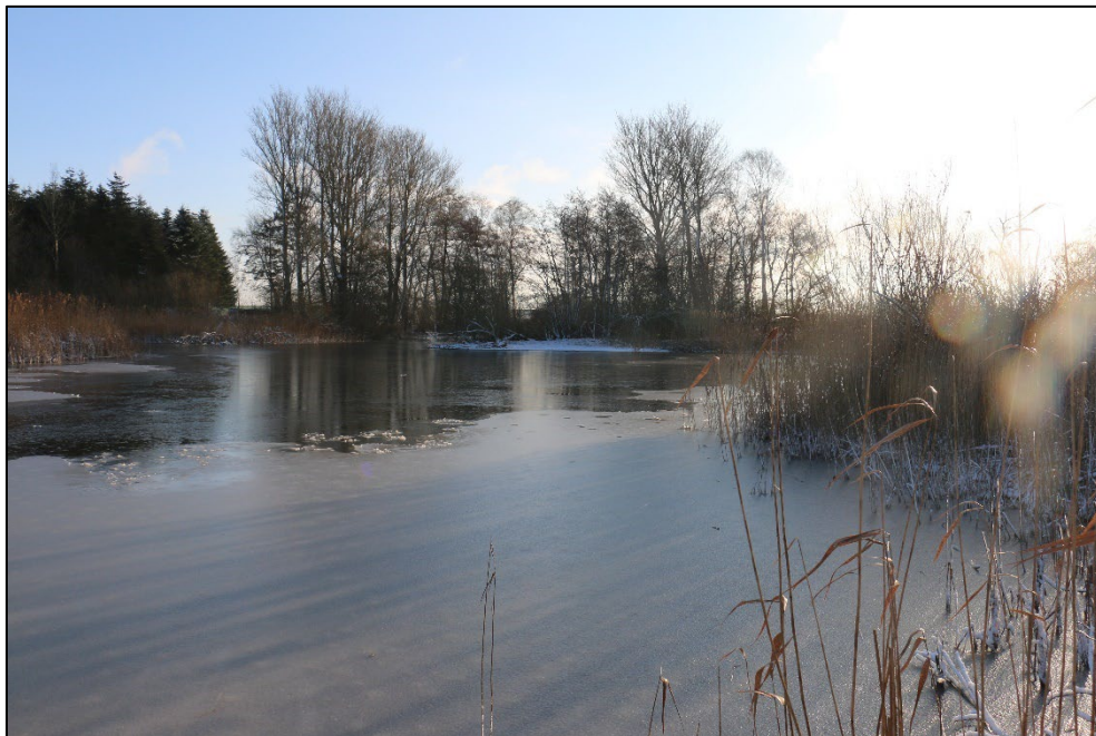
Figur 3-12 Søen set fra nord. Vandspejlet fremstår pga. sin størrelse relativt lysåben på trods af, at søen mod syd er afgrænset af en række træer.