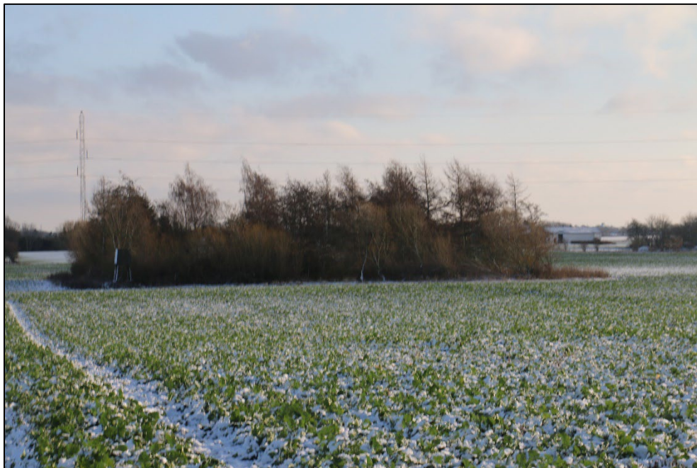
Figur 3-15 Vildtremissen set fra øst.