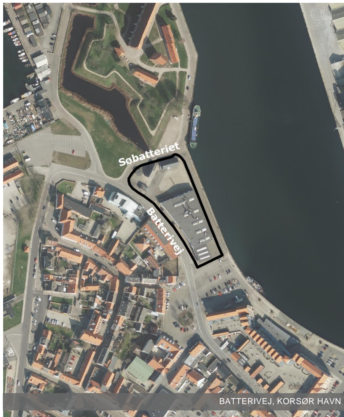
BATTERIVEJ, KORSØR HAVN

Der er modtaget i alt 3 bemærkninger inden for høringsfristen.