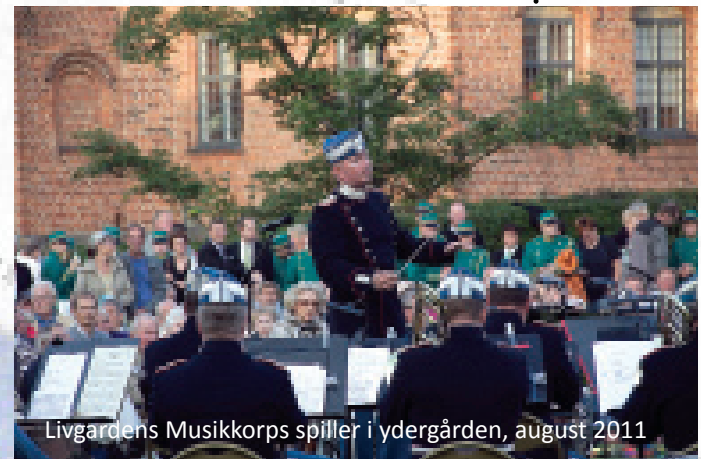
Livgardens Musikkorps spiller i ydergården, august 2011