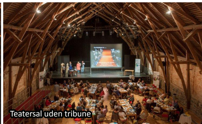
Teatersal uden tribune