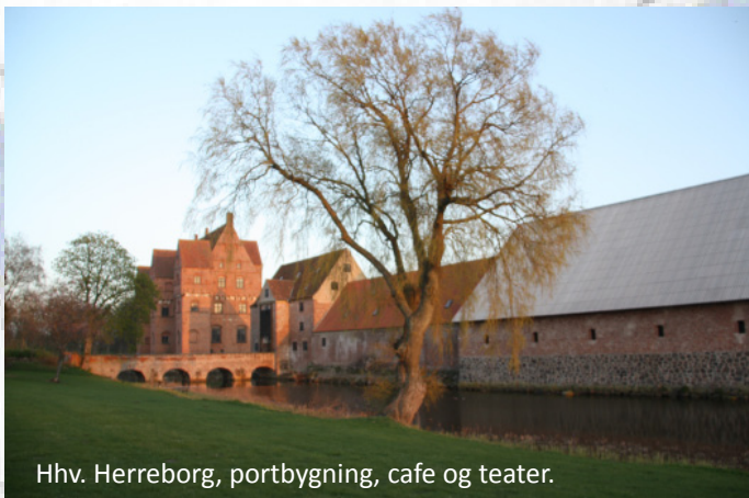
Hhv. Herreborg, portbygning, cafe og teater.