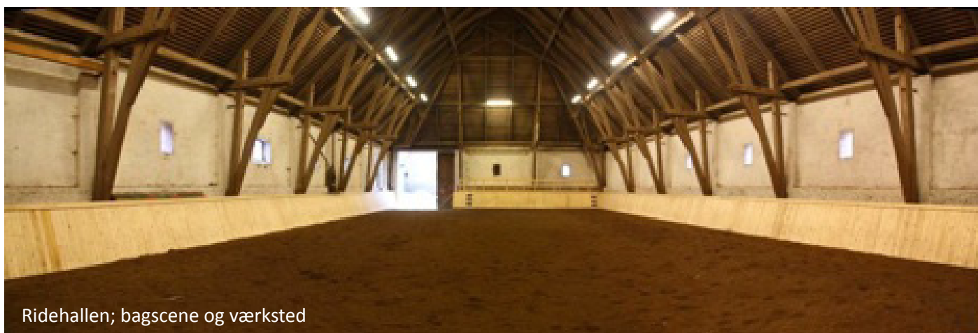
Ridehallen; bagscene og værksted