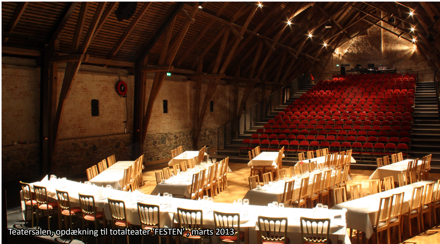
Teatersalen, opdækning til totalteater 'FESTEN', marts 2013

Forstærker: 2 stk. Lab.gruppen C28.4. Fordeler: 2 stk. L-Acoustics LA-AES3. Stage Box: 3 stk. Yamaha SB168-ES. DMX box: 2 stk. ADB mikapack30. DMX node: 1 stk. ELC dmXLAN node6x. DMX switch: 2 stk. ELC dmXLAN switch8 LX. Kranstyring Skab: Kinesys Elevation Smart8. 4 stk. Små speaker monitor . 1 stk. Stor speaker monitor.