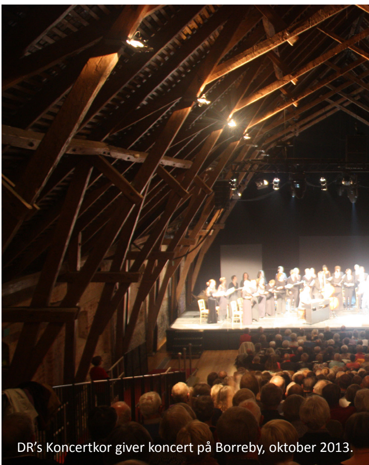
DR's Koncertkor giver koncert på Borreby, oktober 2013.