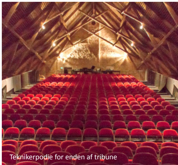
Teknikerpodie for enden af tribune