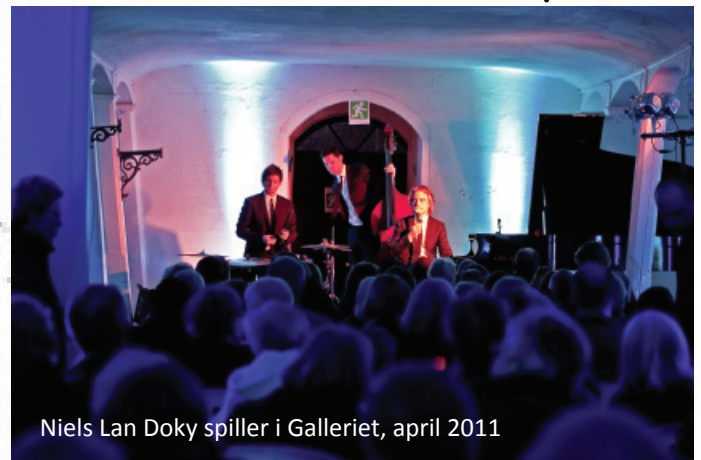
Niels Lan Doky spiller i Galleriet, april 2011