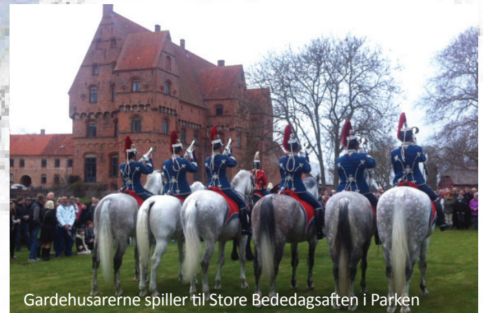
Gardehusarerne spiller til Store Bededagsaften i Parken