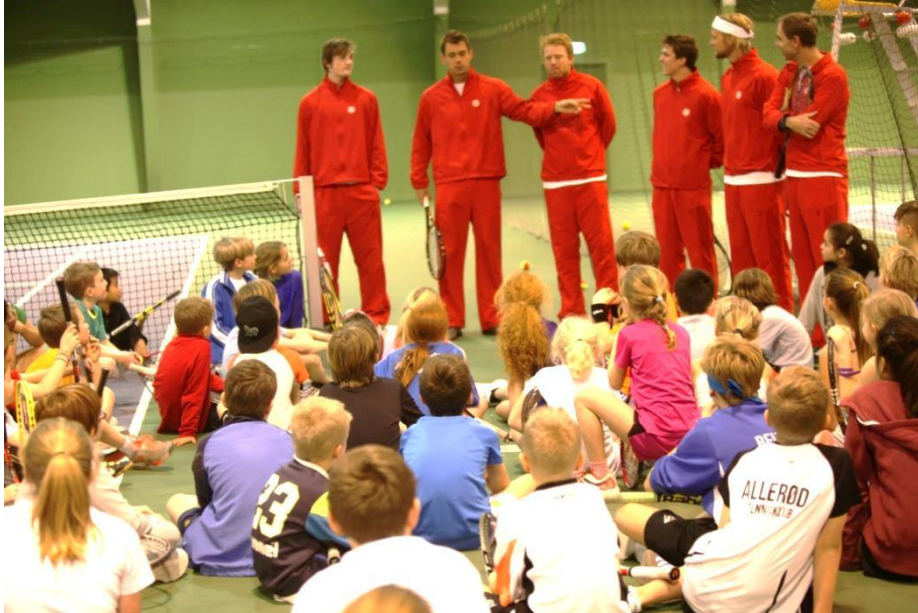
75 børn deltog i Kids Day ifm. Davis Cup-kampen Danmark vs. Cypern.