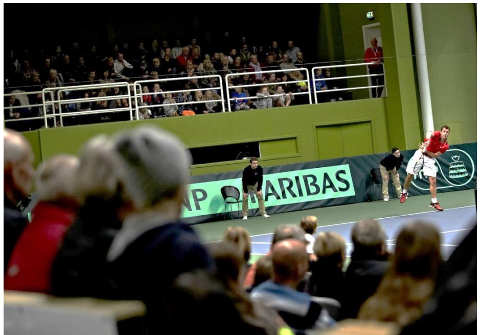
Davis Cup i Hørsholm Rungsted Tennisklub.

Qua rollen som vært forespørger DTF således, om Slagelse Kommune kunne være interesseret i at huse arrangementet. Efterfølgende vil DTF rette henvendelse til lokale tennisklubber med henblik på tilsagn om praktisk støtte. Valget af afviklingssted træffes på baggrund af en række faktorer såsom banens underlag, anlæggets geografiske placering og kapacitet, mulighed for at tiltrække publikum samt ikke mindst muligheden for økonomisk støtte. Den lokale opbakning fra såvel kommune som klub er ofte afgørende for valg af værtsby.