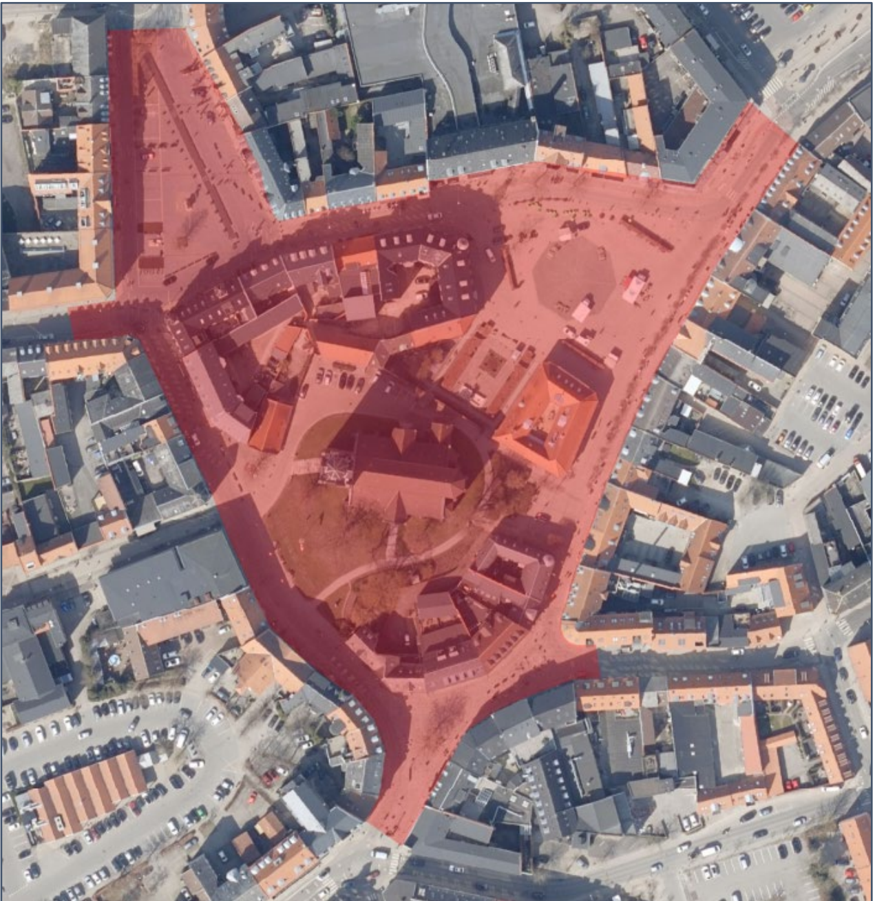
Gågadeområdet i Slagelse bymidte

Pullertanlæggene lukker for biladgang til gågadeområdet i Slagelse bymidte, og er lokaliseret ved Gl. Torv, Løvegade, Schweitzerpladsen, Smedegade og Skovsøgade.