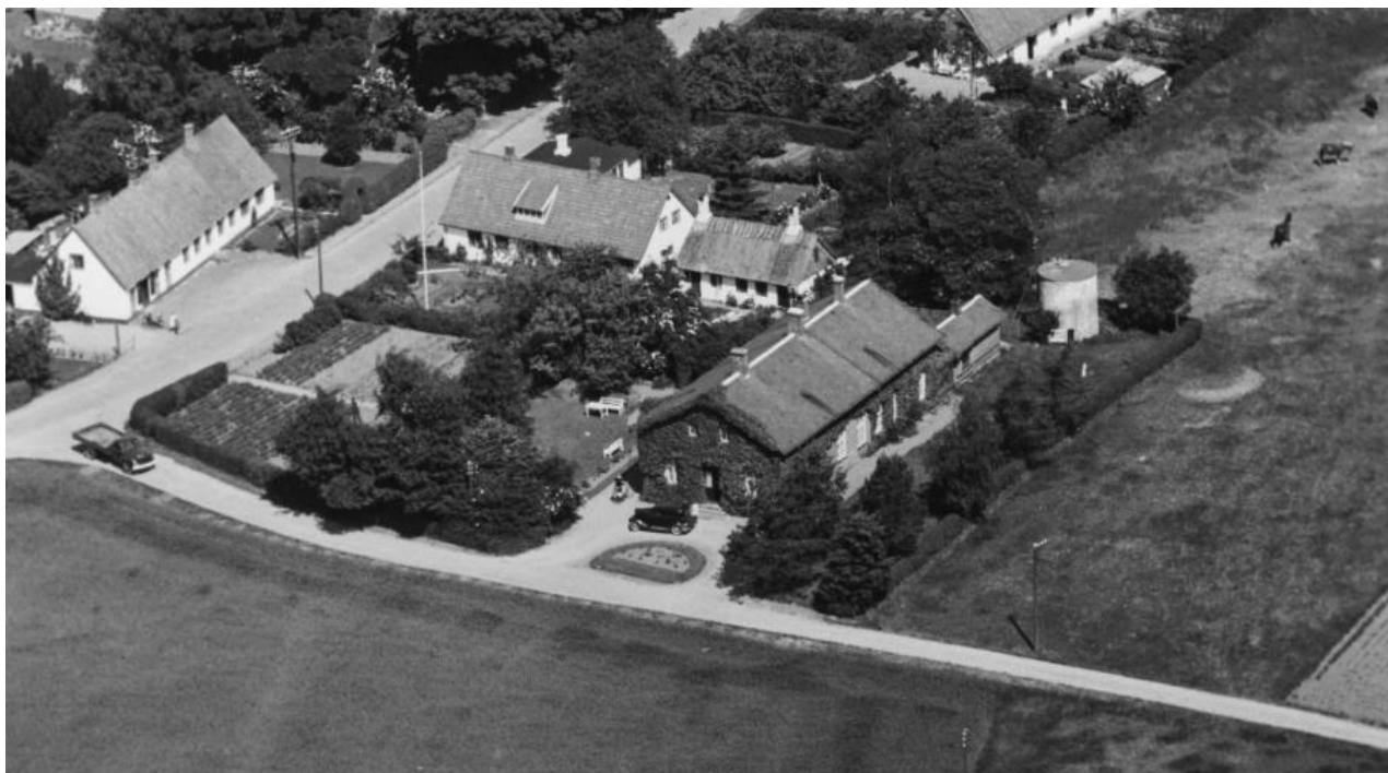
Danmark set luften 1949

Om Sygehuset: Er skænket af grevskabet der i 1902 lod det bygge af materialer fra nedrivningen af købmandsgårdens kornmagasiner ved kroen i Bisserup samt fra Røde hus i Sterrede og Østhuset på Glænø. Der var plads til 10 patienter, og en operationsstue samt laboratorium. Sygehuset blev meget anvendt af lægerne i de tilstødende kommuner.