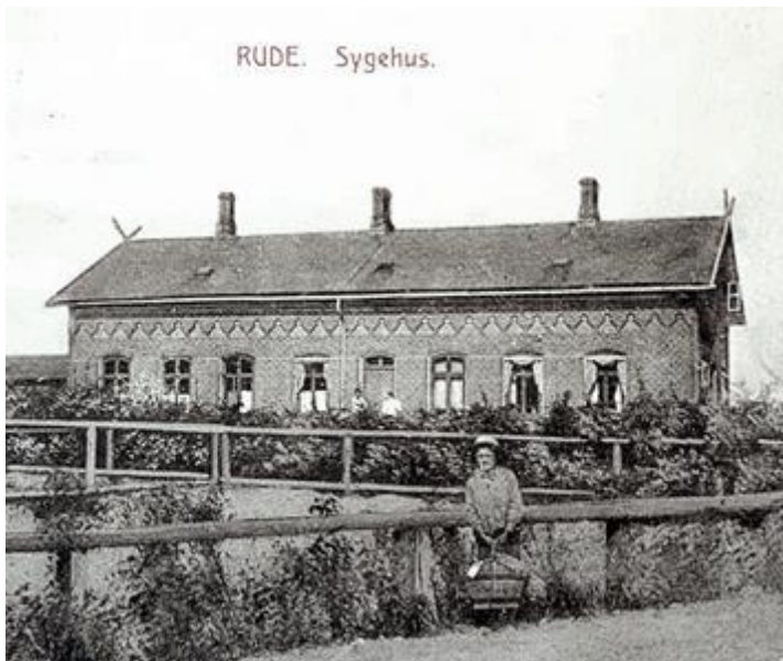
Postkort uden årstal.

Der planlægges for ny anvendelse af hospitalets bygning, idet der ombygges til boliger. Den nye anvendelse vil bidrage til at bevare bygningen, så den fortsat kan fortælle sin historie i gadebilledet. Rude har med birkedommerembedet og Holsteinborg haft flere funktioner end andre landsbyer, og er udpeget kulturmiljø. Bygningen har i sig selv lav SAVE-værdi, hvilket må tilskrives flere om- og tilbygninger. Man bør ved den nye anvendelse/ombygning sikre at hospitalets originale bygningstræk, herunder vinduesrytmer og facadeudsmykning ikke sløres yderligere.