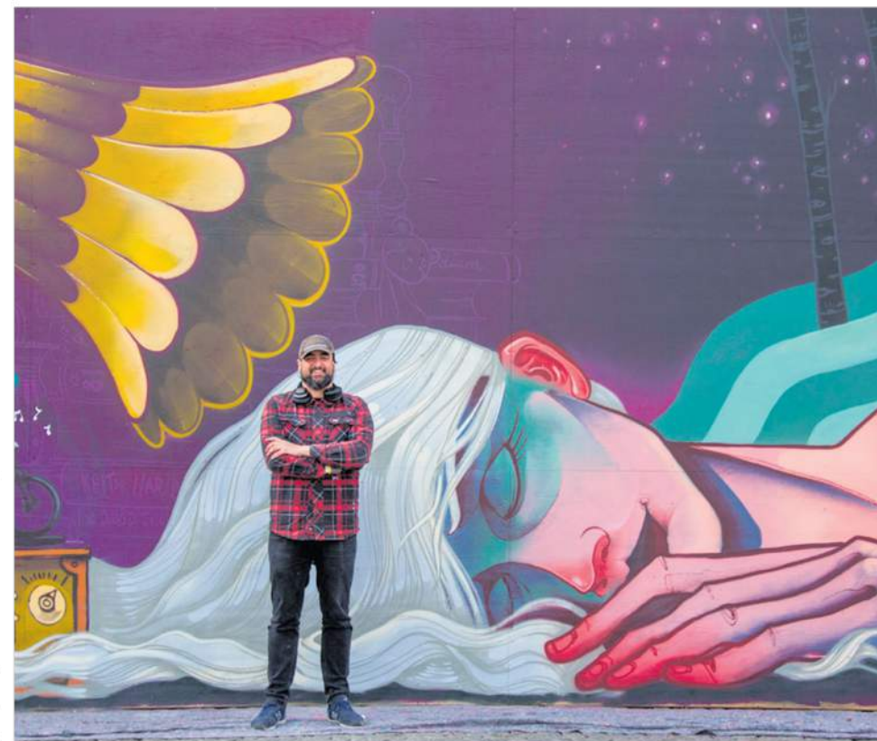
Den spanske street art kunstner Isaac Malakkais udfolder d. 1. marts sine kunstneriske evner hos Beierholm i Slagelse.

Ved mødet præsenteres også en video fra Slagelse Street Art Festival 2021, og der overrækkes bøger og fo-