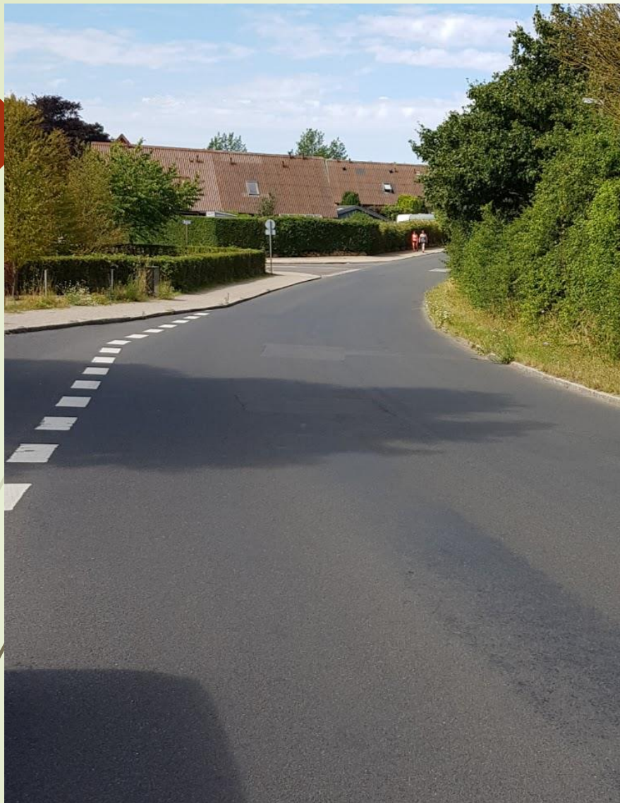
Svinget et fra Frølundesiden. Adgangsvejen kommer bag på bilister, der kommer herfra.