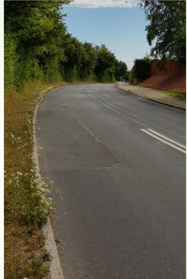
Svinget set fra Mælkevejsiden. Her får man indtryk af, hvor ringe oversigten er til venstre med det nuværende forslag til udkørsel midt i buen t.v. i billedet