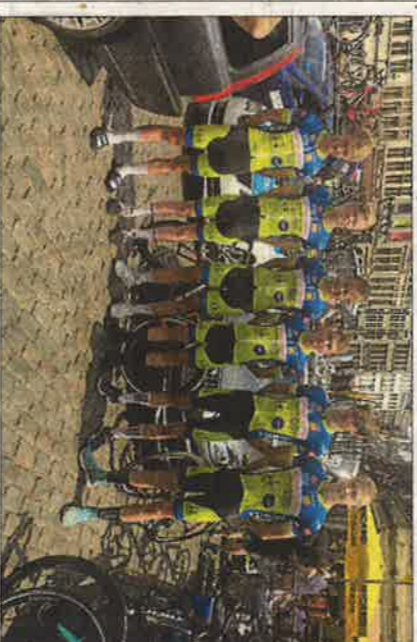
De seks førstårsryttere fra Team Hechmann gjorde en flot figur ved etapeløb i Belgien.