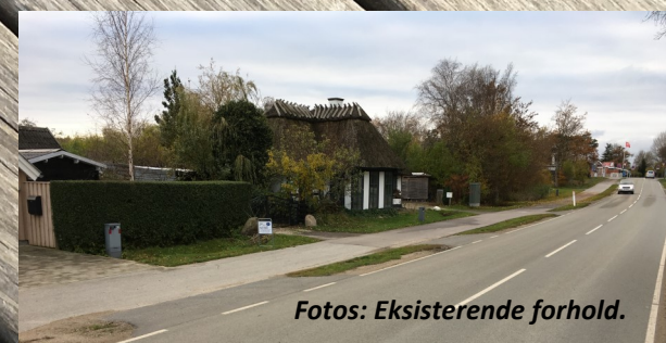
Fotos: Eksisterende forhold.