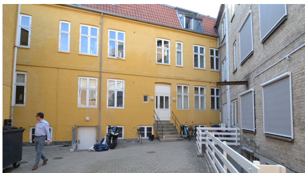
Kig mod gårdrummets nordvestlige hjørne