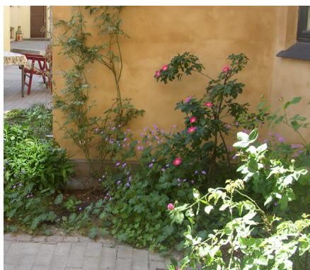
Eksempel på facade med beplantning