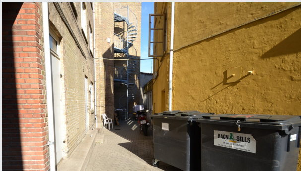
Kig mod gårdrummets østlige hjørne - bygningen til højre er baghuset der nedrives