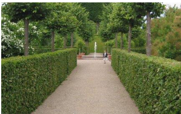
Eksempel på slotsgrus, som foreslås i gårdhaven og bøgehæk, som foreslås at skærme affaldsbeholderne