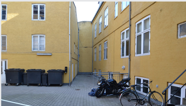
Kig mod gårdrummets sydlige hjørne - bygningen til venstre er baghuset der nedrives

Selve anlægsarbejdet forventes at vare ca. 4 måneder, så det kan afsluttes inden udgangen af 2015.