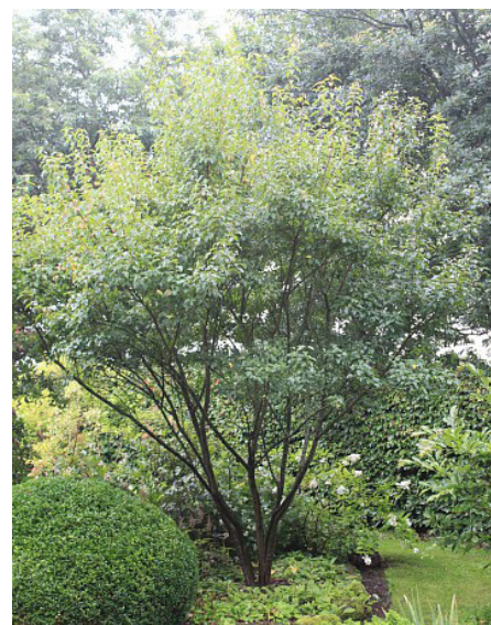
Eksempel på et flerstammet træ (Ildløn)