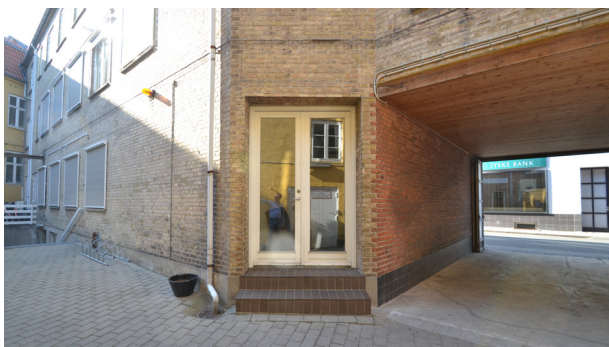
Del af gårdrum og porten til Klingeberg