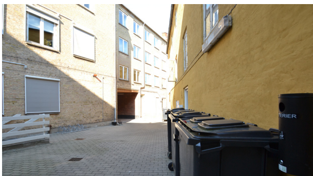
Kig mod gårdrummets østlige hjørne langs bygning der nedrives (den pudsede gule facade)