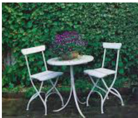
Eksempel på mobil og enkel møblering

Adgangen til gården er som i dag gennem porten fra Klingeberg.