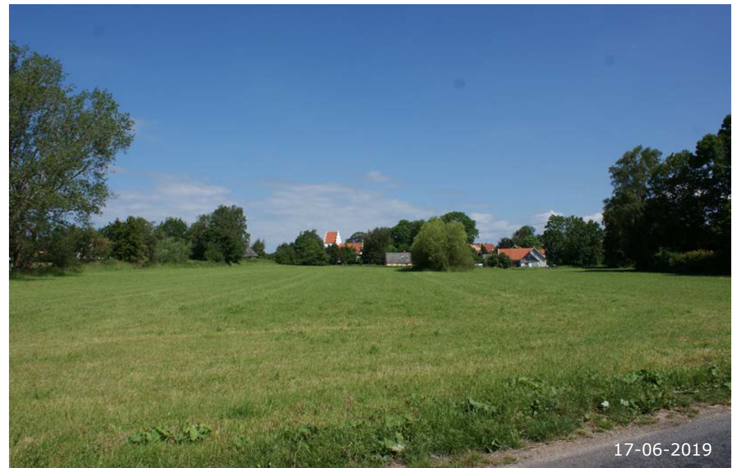
Kig til kirketårn og bebyggelse fra Halkevadvej. Et af de få, åbne kig mellem landsbyens midte og det omgivende landskab.