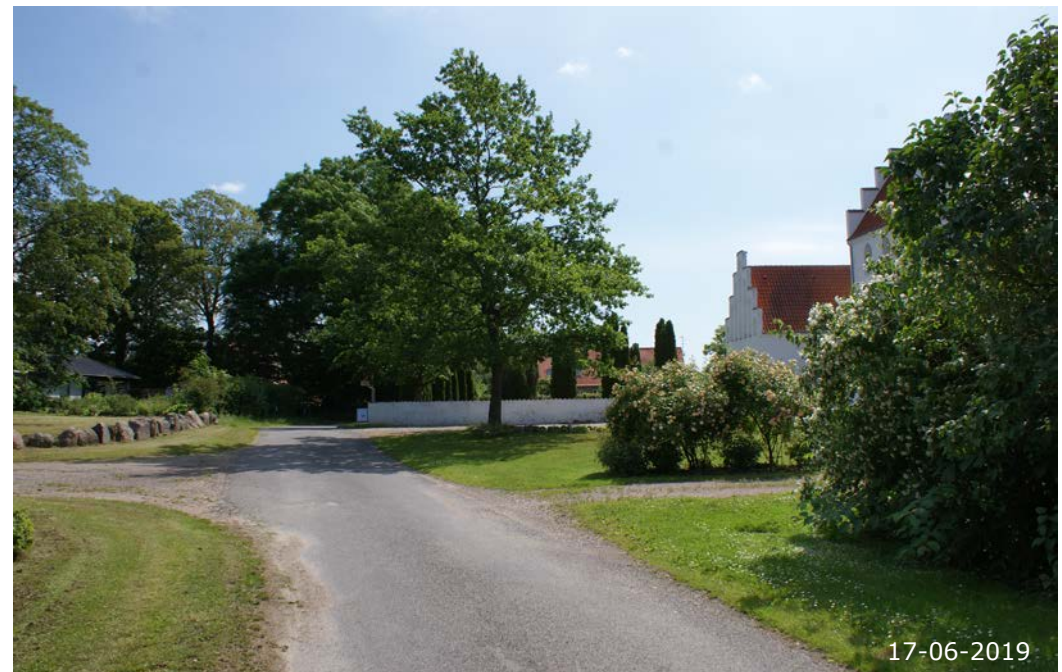
Skoletoften. Kirken er centralt placeret i landsbyen. Vejene er smalle med græsrabatter. Generelt har landsbyen et grønt præg med hække og store træer.