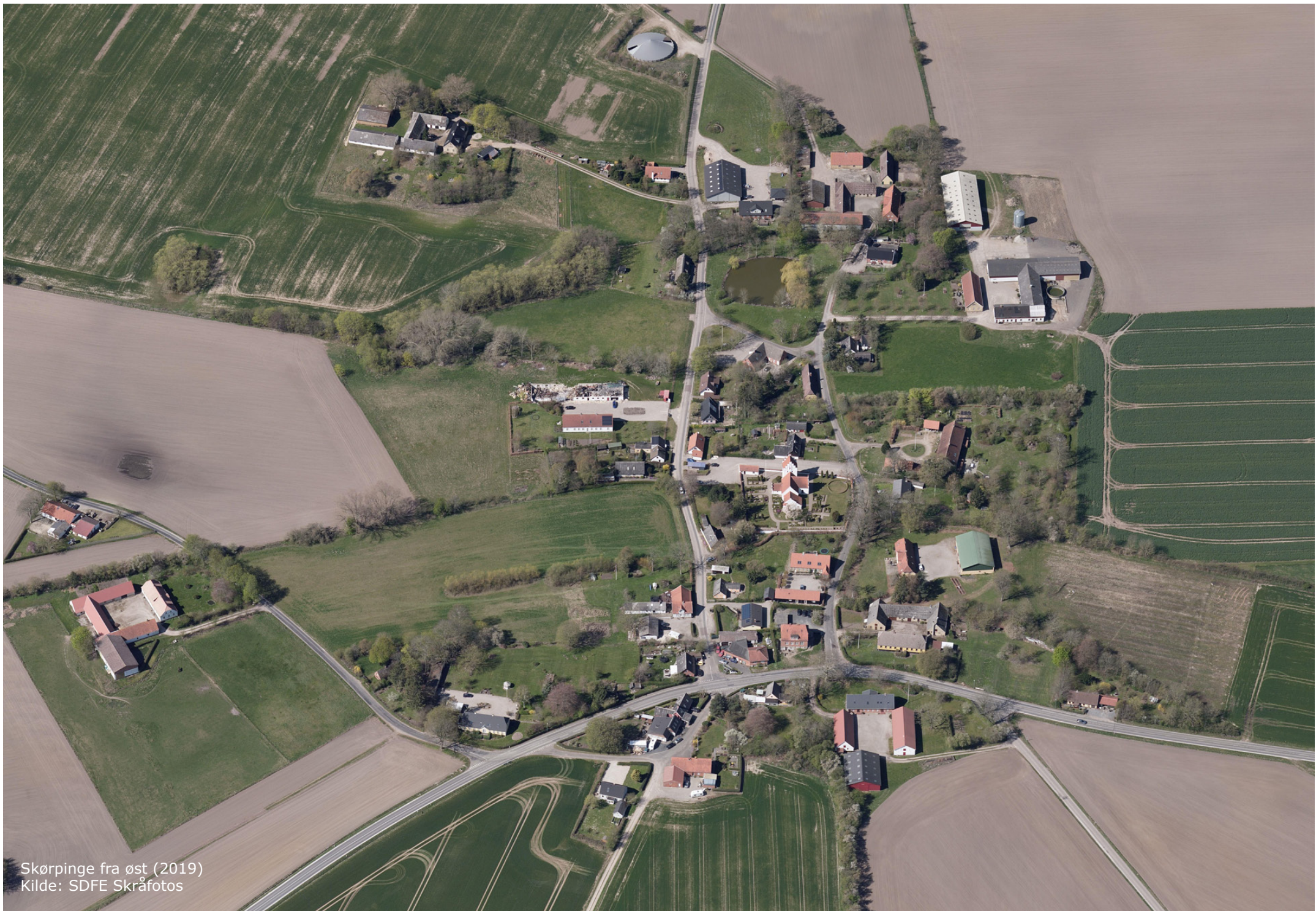
Skørpinge fra øst (2019)