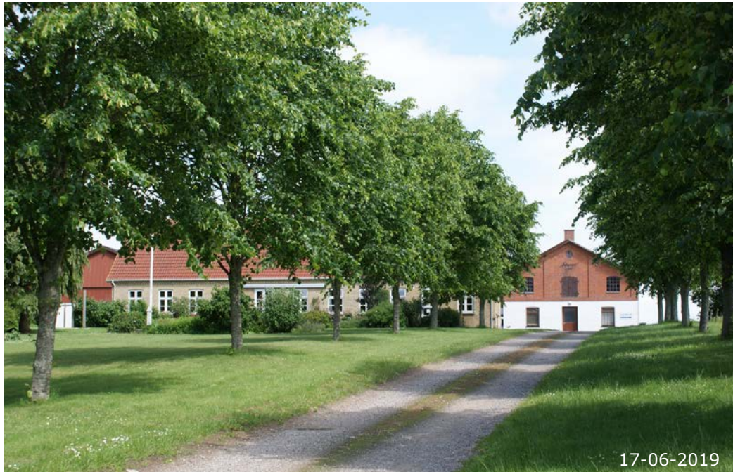
Skoletoften 12. En af de udflyttede gårde. Stuehuset er som flere andre bygninger i landsbyen opført i gule mursten.