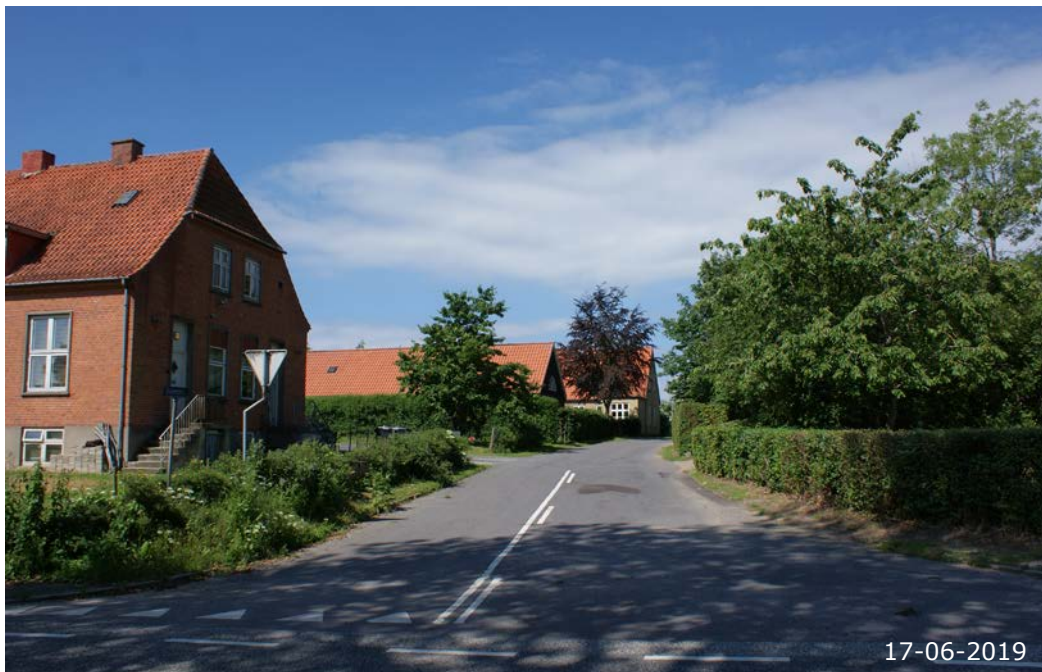
Skoletoften set fra Slagelsevej. Den røde bygning forrest til venstre er den tidligere landsbyskole (oprettet i første halvdel af 1900-tallet, i dag bolig).