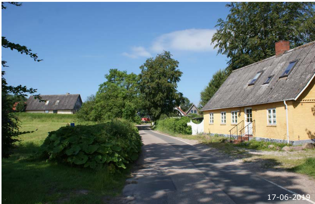
Skørpingevej i et kig mod vest. Det gule hus er Skørpingevej 17 - et traditionelt længehus, men som de fleste i landsbyen præget af ombygning og modernisering.