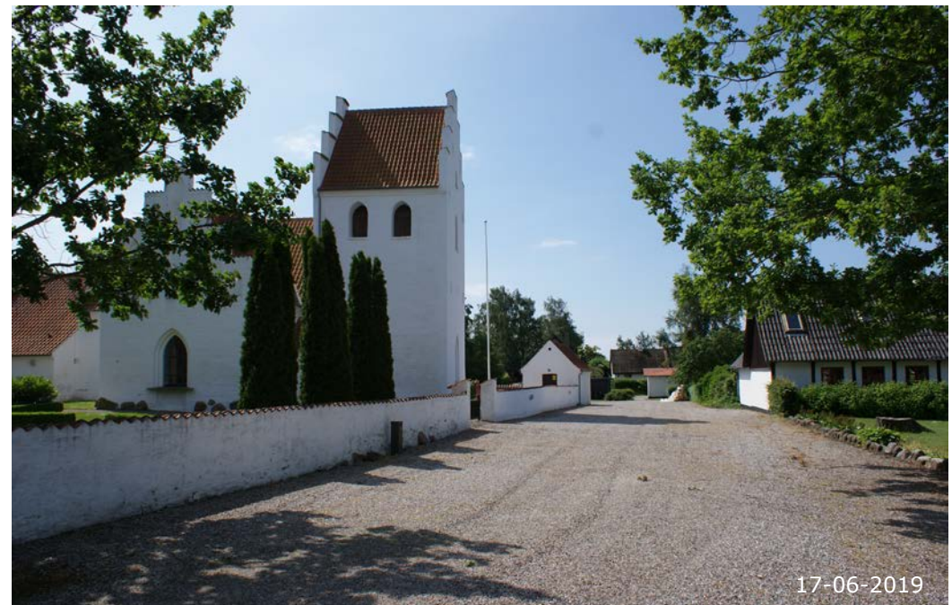
Passagen ved kirken, som forbinder de to parallelveje Skoletoften og Skørpingevej.