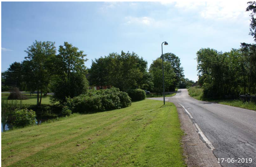
Skørpingevej i et kig mod øst. Gadekæret og det relativt store fælles grønne areal ses til venstre. Forsamlingshuset anes i baggrunden mellem træerne.