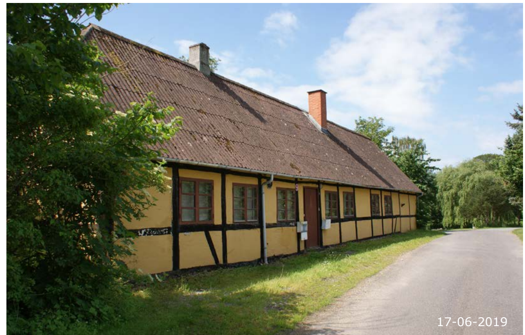
Skoletoften 9. Den tidligere poge- og håndarbejds-skole (bygningen er opført 1857).