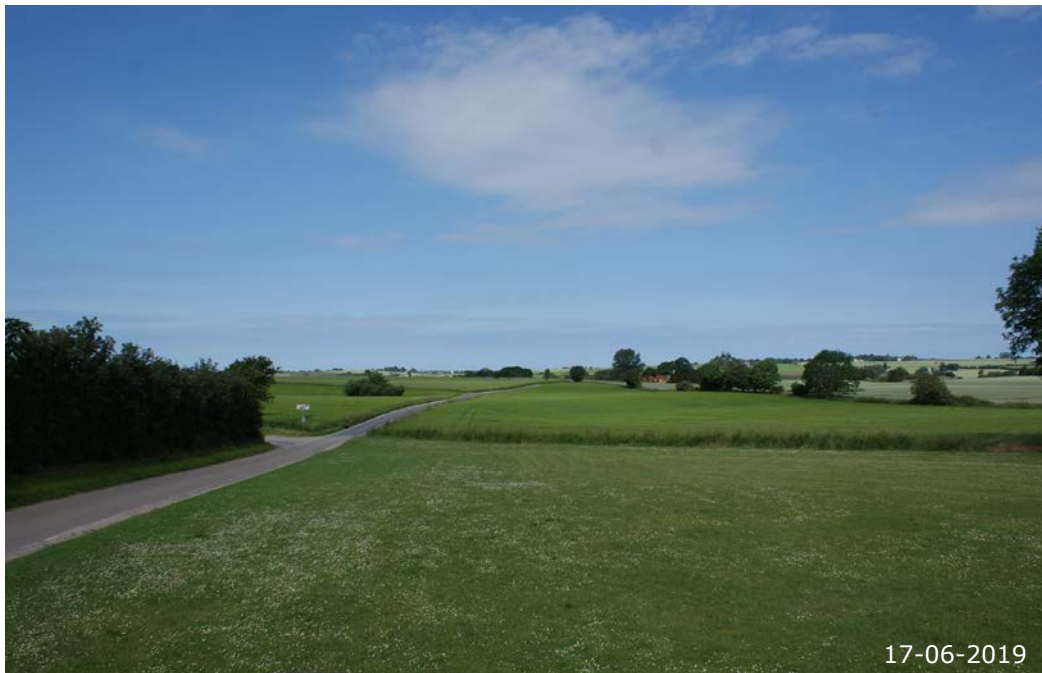
Skørpingevej mod vest. Det let bølgede marklandskab omkring Skørpinge falder mod syd og vest ned mod Lindes Å.