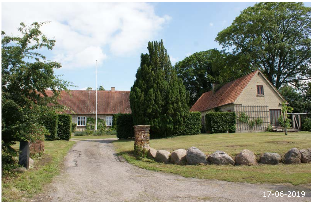
Skoletoften 8. Den tidligere præstegård (opført 1884) ligger i det bånd af udflyttede gårde, som omkranser kirken og gadehusene på den tidligere fællesjord.