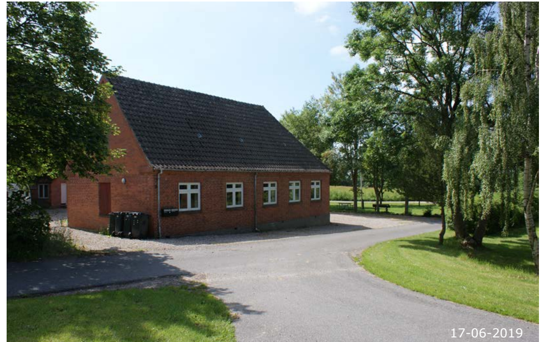
Skoletoften 11. Skørpinge Forsamlingshus. Forsamlingshuset ligger ved gadekæret i den vestlige ende af landsbyen.