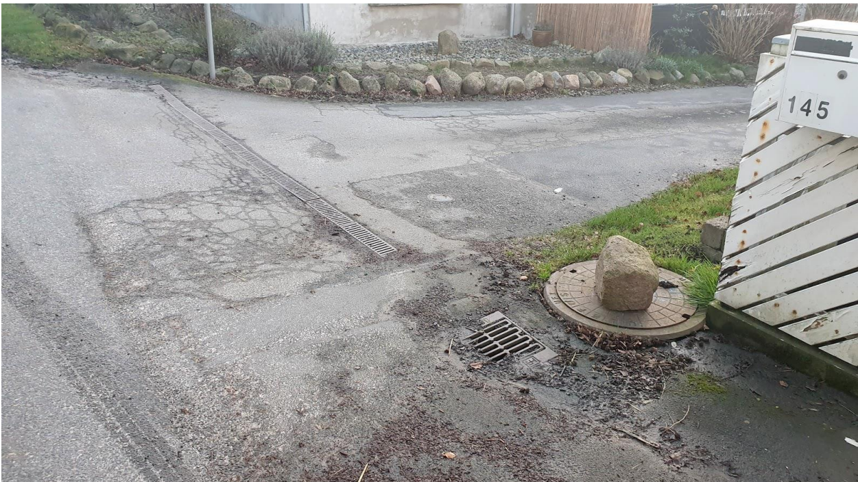
Manglende affald omkring kloak og et underdimensioneret vejdræn ud for Strandvejen 145.