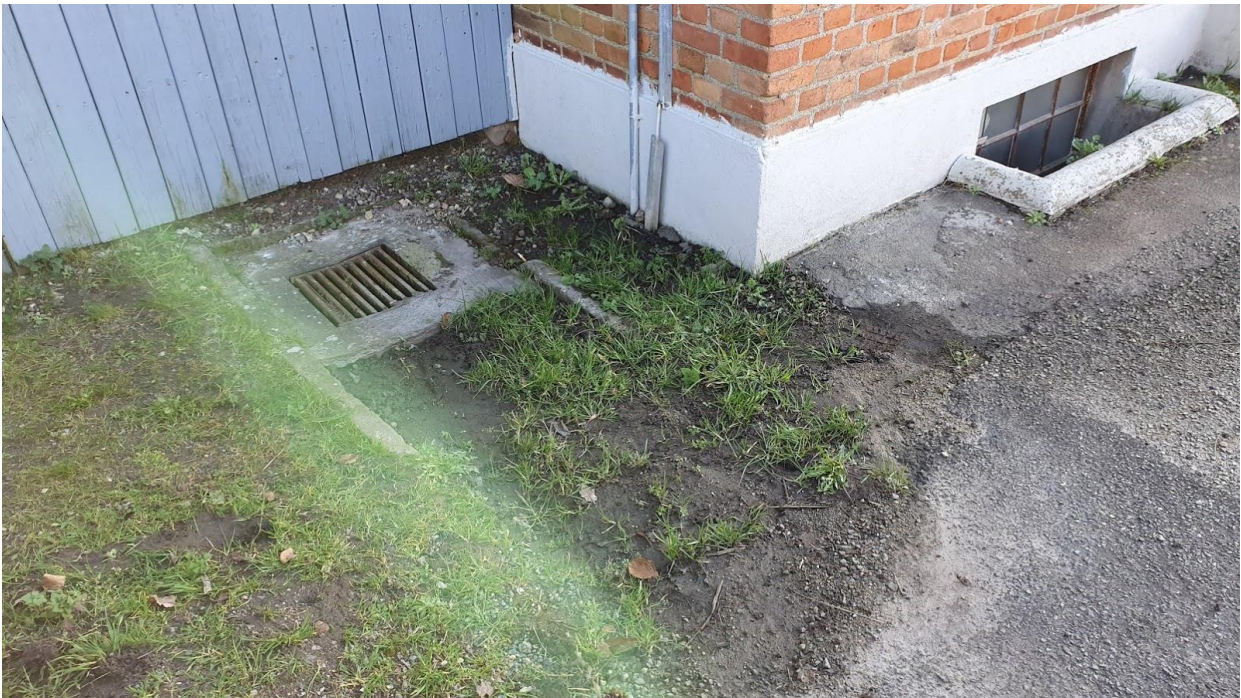
Kloakken tættest ved Brugsen med stort ikke-asfalteret område omkring og vandindtrængning under fundamentet.

Ud for Strandvejen nummer 145, er der også et underdimensioneret vejdræn som sander til og større mængder vand strømmer ned mod Strandvejen 137, 139 og 141