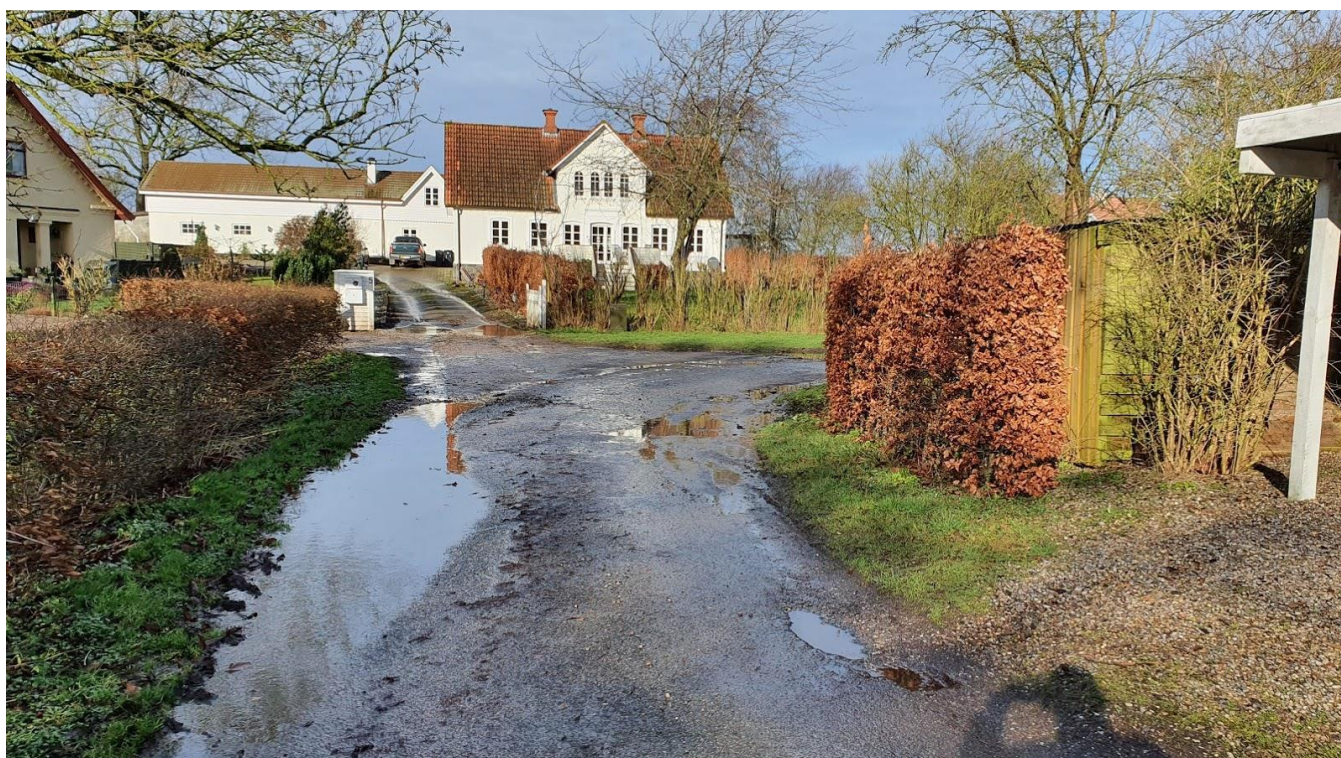
Starten af Lodagervej retning nord.