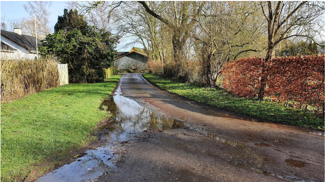
Svinget ud for Lodagervej 5