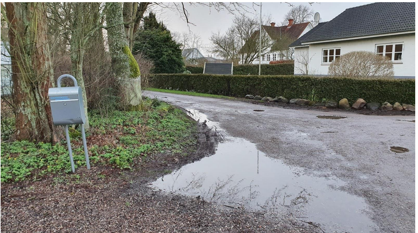
For enden af den offentlig del af Lodagervej ved kirkens bagerste parkering.