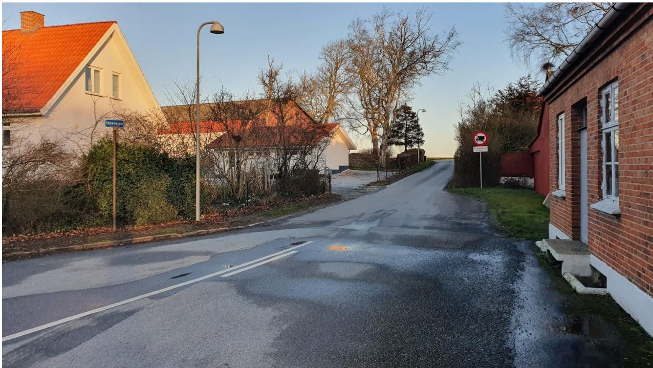
De 2 kloaker er placeret i hver side af Hovvejen ved den gamle Brugs.

Vandet kommer fra 2 stk. vejbrønde som ikke er påført kloakeringskortet og de er placeret for bunden af Hovvejen ved den gamle Brugs. Disse brønde har også en stor gennemstrømning af drænvand fra den højereliggende del af vejen. Hvorvidt der er ført andre afløb fra vejvloaker til gadekæret, er mig uvis.