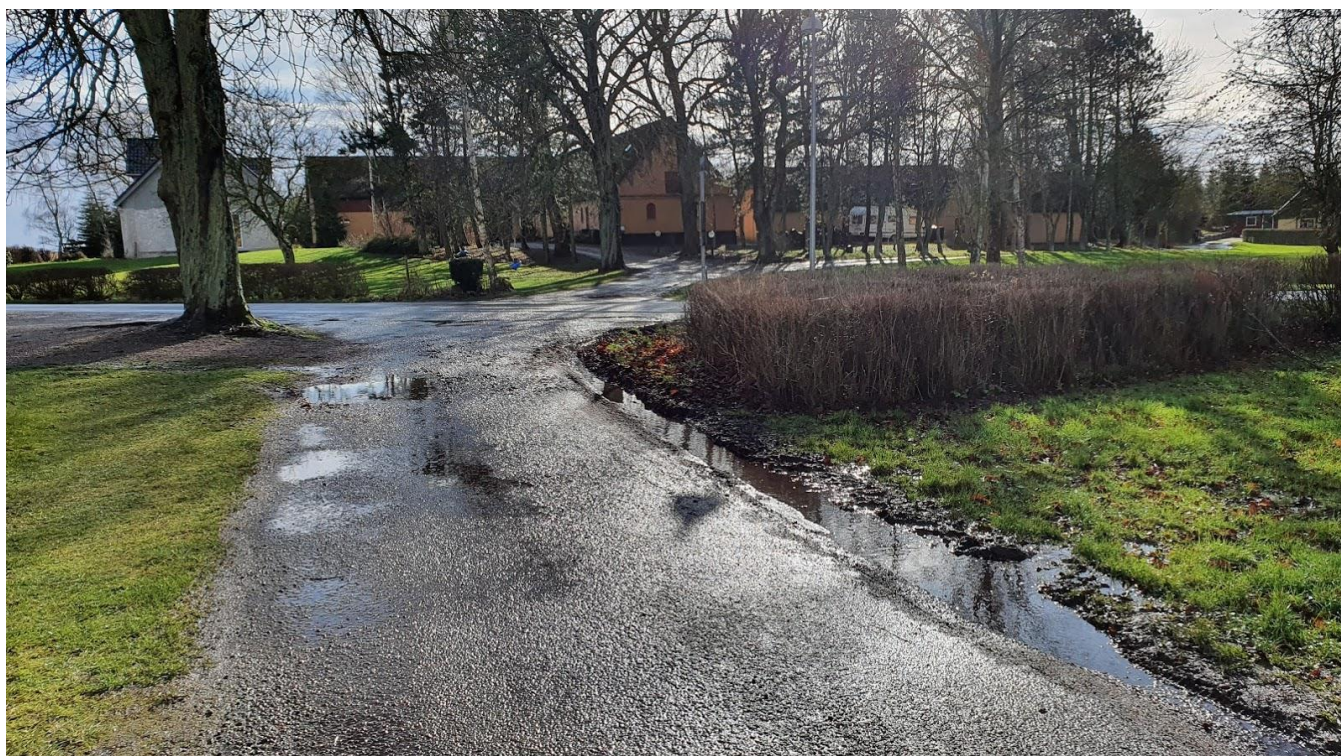
Starten af Lodagervej retning syd.