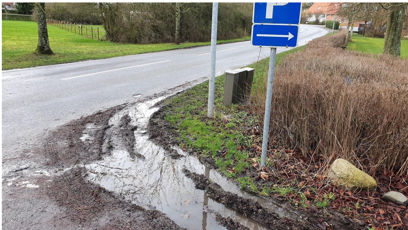
Indgangen til Lodagervej

I forbindelse med opgravning af Lodagervej, bør der sættes vejbrønde af. Siderne langs vejen står ved nedbør under vand og bliver kørt til mudder, når biler mødes på den smalle vej mod kirkens bagerste parkeringsplads.