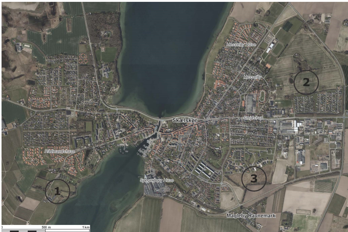
Kort over de 3 områder i Skælskør.