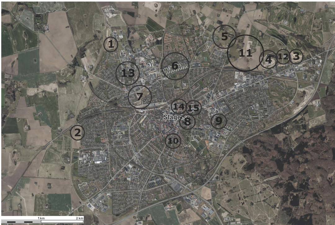
Kort over de 15 områder i Slagelse.