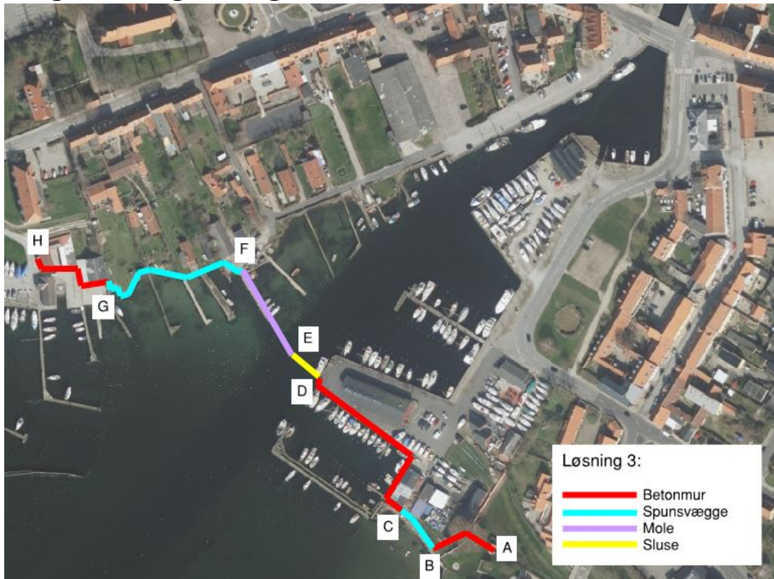
Figur 1: Sikringsforslag 3, linjeføring og principper for sikring af havnen.